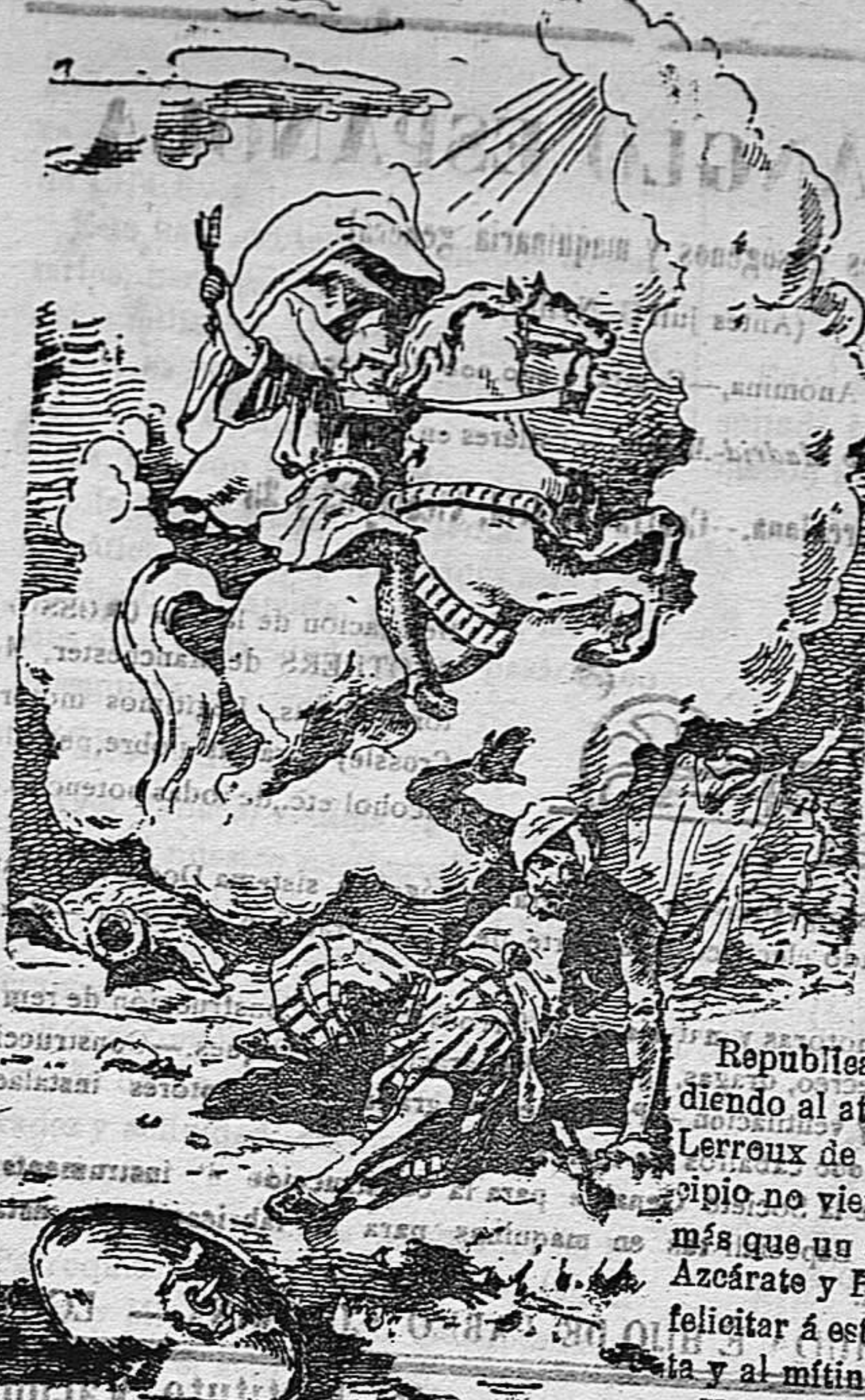
Juvicio Mártir San Jorge! Veni en adiutorium populo Dei. Defiende al pueblo de Dios