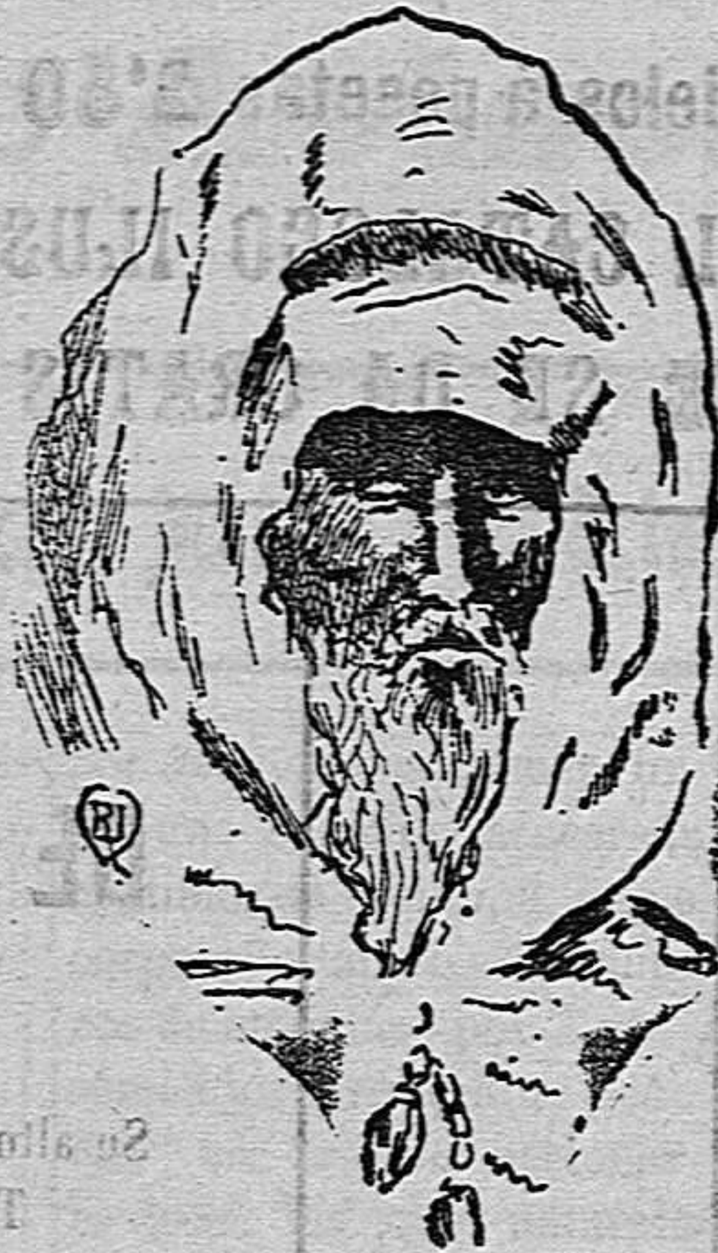
Ma-el-Aimin (El Morabito Azul)

mo en Argelia, las Sociedades secretas que hay en el imperio. Esas sociedades han nacido en el Islam, de un modo análogo á las que han nacido en China (los boxers ), en la India (los tuangs ) y en Cuba (los ánigos ), contra los europeos.