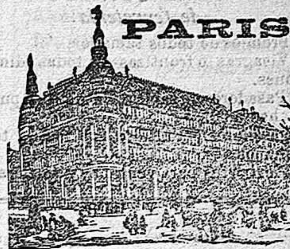
GRANDES ALMACENES DEL