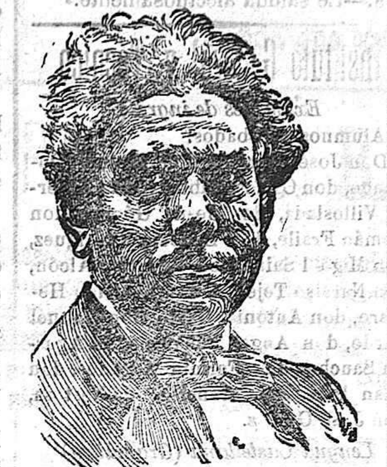
El maestro Vives, autor de la música de MARUXA

que Amadeo Vives ha dado de que le sobra inspiración y cultura musical para codearse con los más geniales compositores; pero en fin, es el último y acaso el más valioso, el que hasta ahora ha conquistado la más estimable rama de laurel con que ha de ceñir su frente el autor de La balada de la luz.