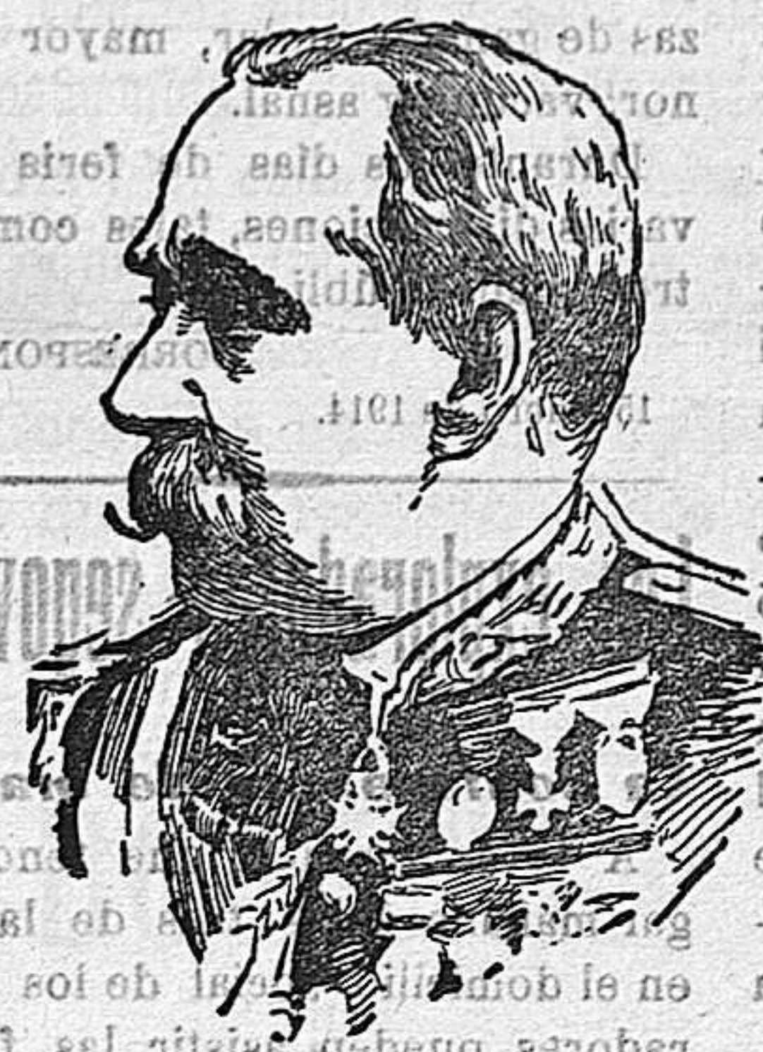
GENERAL DON CAMILO POLAVIEJA