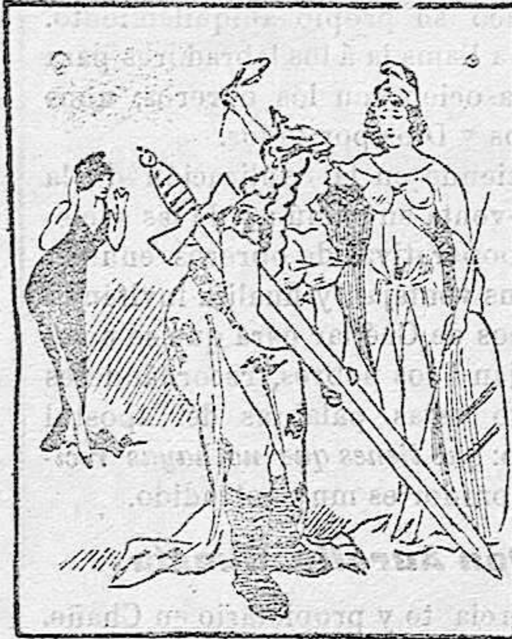
La locura de Germania ó el exceso en todo

A pesar tuyo, la espada terminará por ser tan pesada que no podrás con ella.