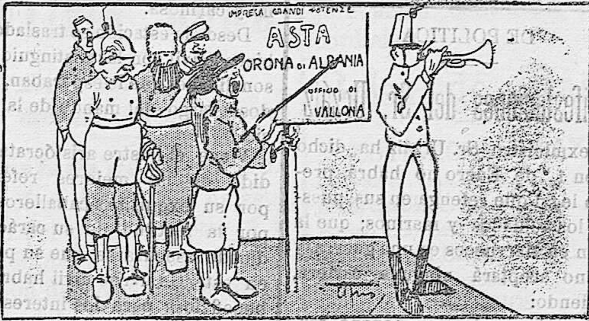
Animarse, señores, animarse; se trata de una corona nuevecita e inédita De Pascino, de Turin