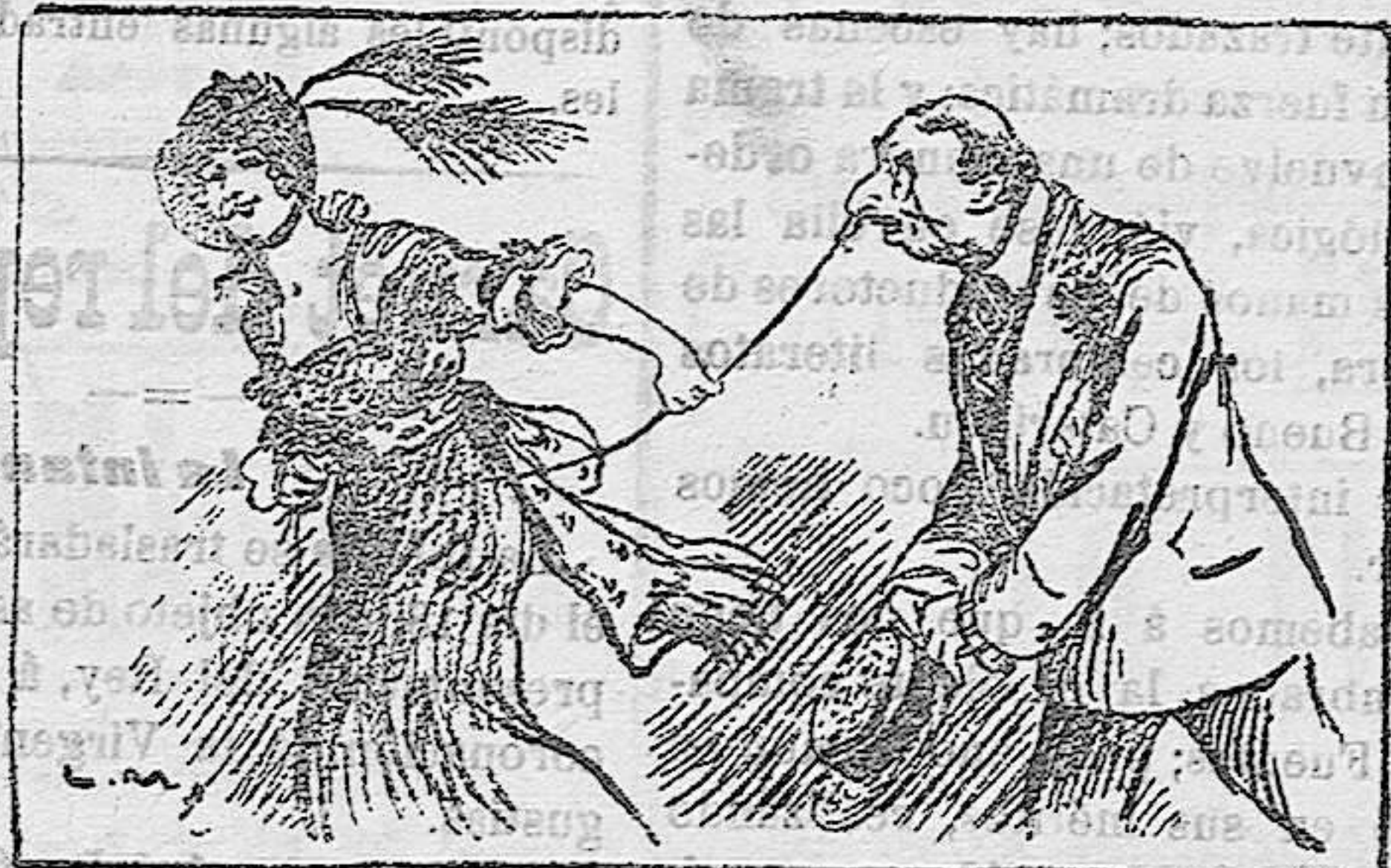
Para lo que servirá el anillo en la nariz, de extenderse su uso al sexo fuerte.

—Real orden disponiendo se devuelva a doña Ana Olín López 250 pesetas de las 500 que ingresó para reducir el tiempo de servicio en filas de su hijo Cándido Figa Olín.