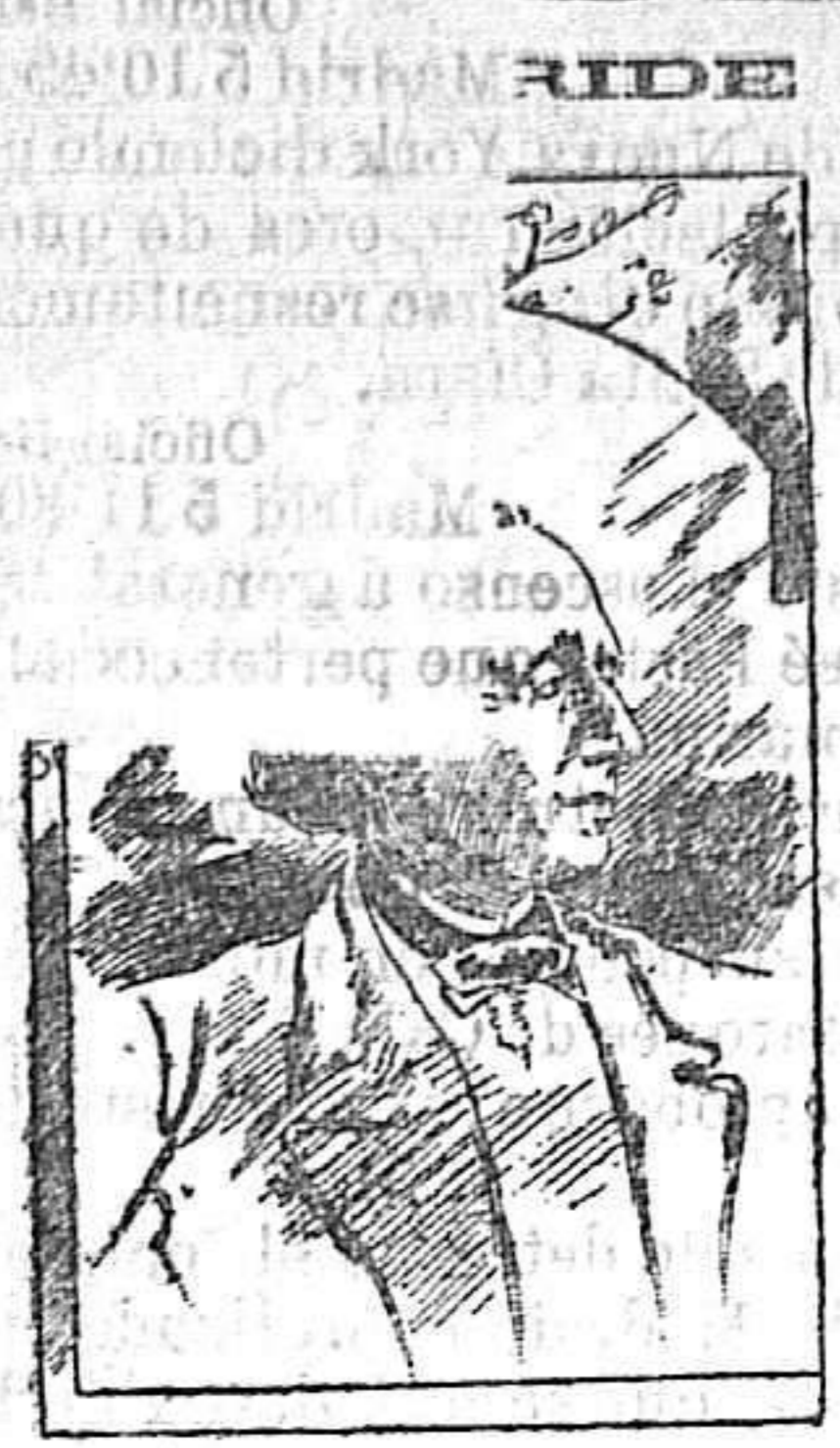
5 de Agosto de 1875 Muere Andersen

Nació Andersen en Odensea (Dinamarca) el 2 Abril de 1805, de familia pobre. Contaba solo 12 años cuando escribió dos tragedias, naturalmente irrepresentables. A los 14, muerto su padre, pasó á Copenhague sediento de gloria, con una docena de escudos por todo capital. Gastados éstos entró de aprendiz en una carpintería y luego se presentó al empresario Siboni, que fué su protector decidido, colocándole de bailarín en su teatro, figurando más tarde como corista. Dos años después escribió obras para dicho teatro, pero no tuvo el honor de que se representasen. Al poco tiempo el preboste obtuvo para él de Federico VII una beca en el colegio de Slagelse. Tenía 19 años y se aprovechó grandemente de sus estudios, prosiguiéndolos desde 1828 en la universidad de Copenhague. Por entonces sus poesías comenzaron á dar nombre, siendo algunos años después el autor más en boga de su nación. Murió en 5 Agosto 1875, á los 70 años de edad.