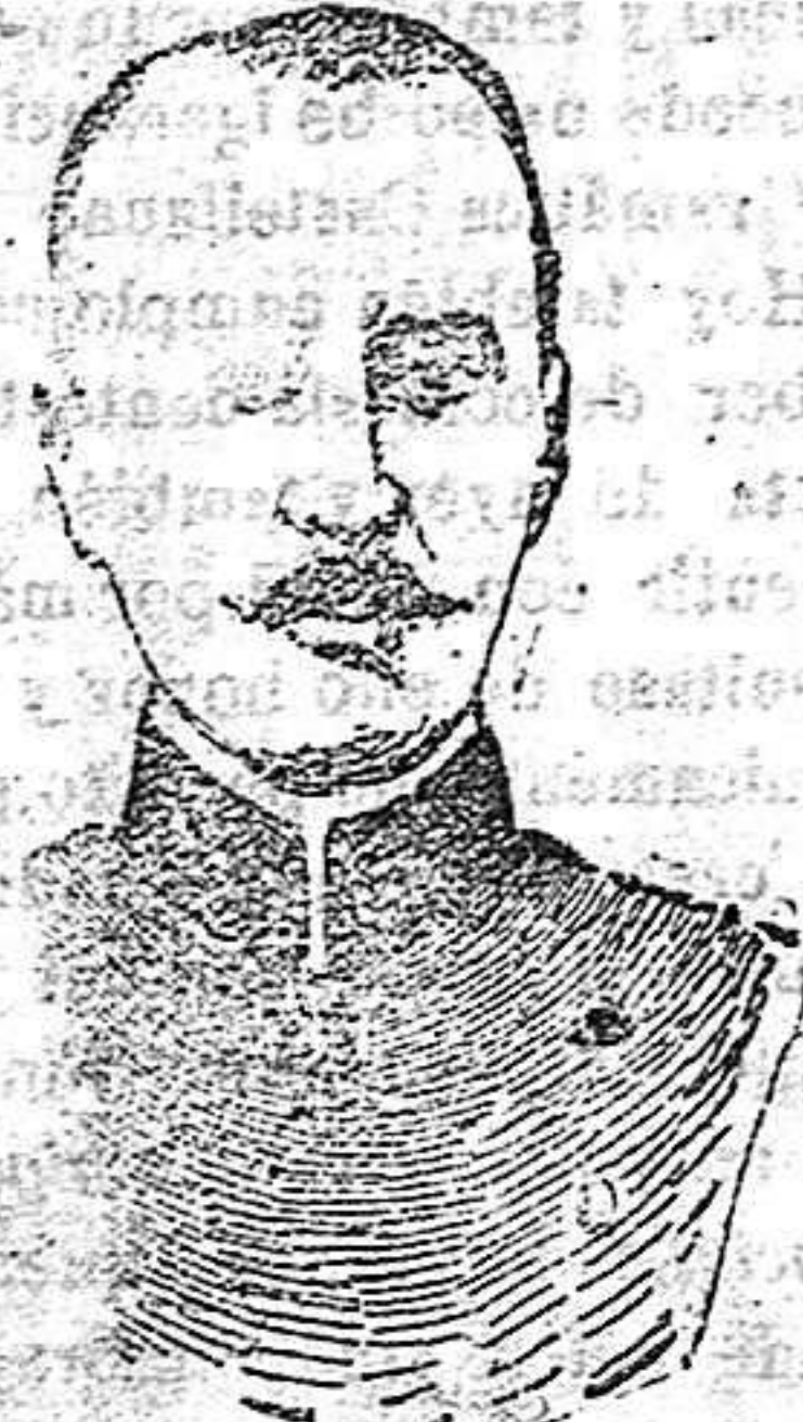
General Teherbatcheff, comandante del ejército ruso que pelea en la Galitzia contra el austro alemán del conde Bothmer.