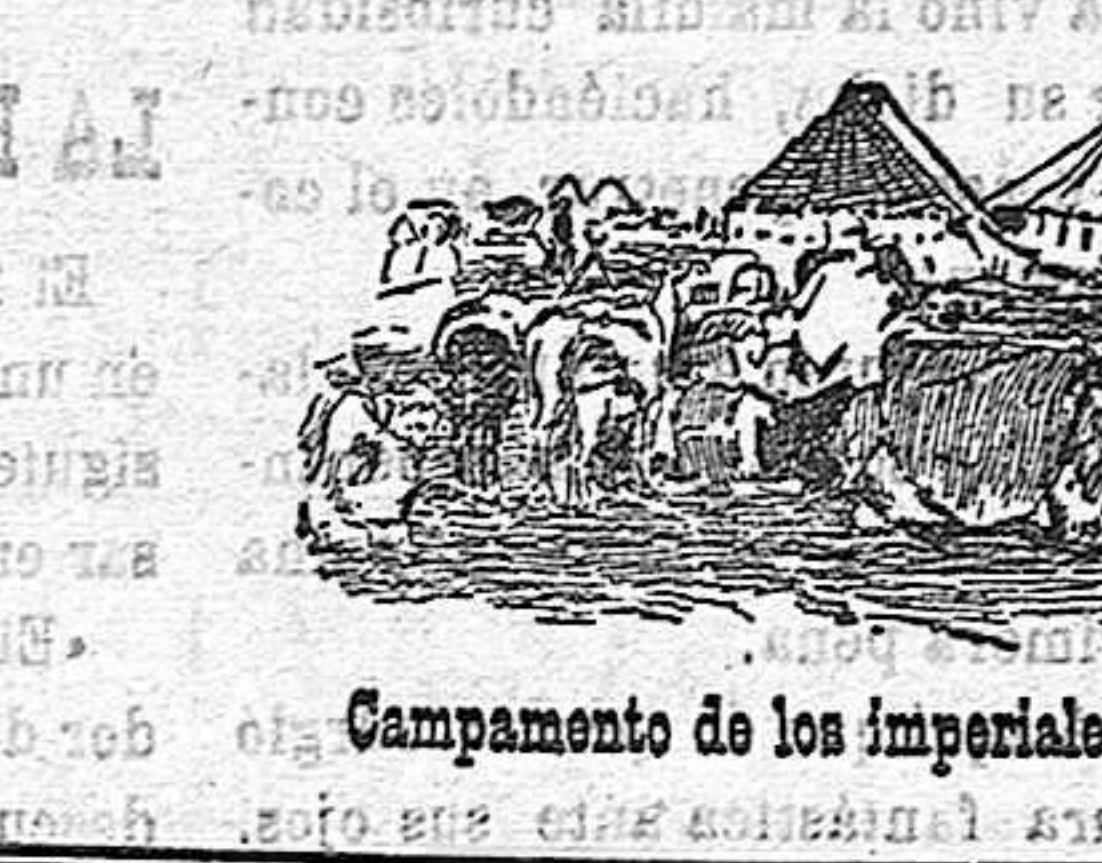
Campamento de los imperiales en las orillas del Molya