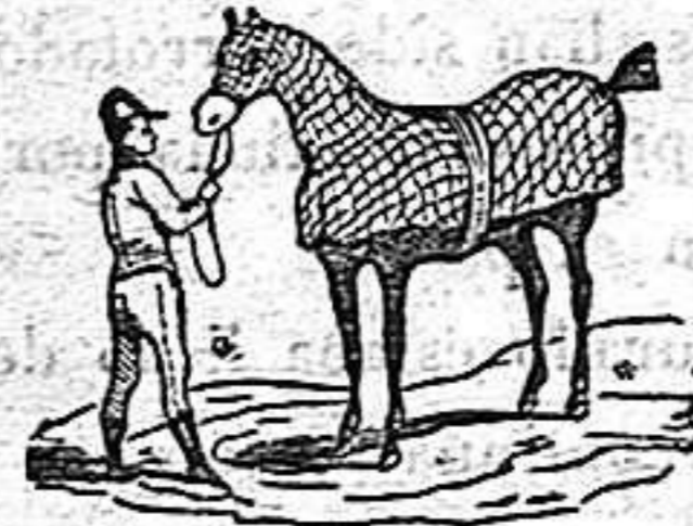
Un caballo en venta para tiro.

Hay de venta un carro de una caballería, en muy buen estado de servicio, y á precio equitativo. Tambien hay de venta los arreos correspondientes á la caballería. En la librería de esta imprenta darán razon.