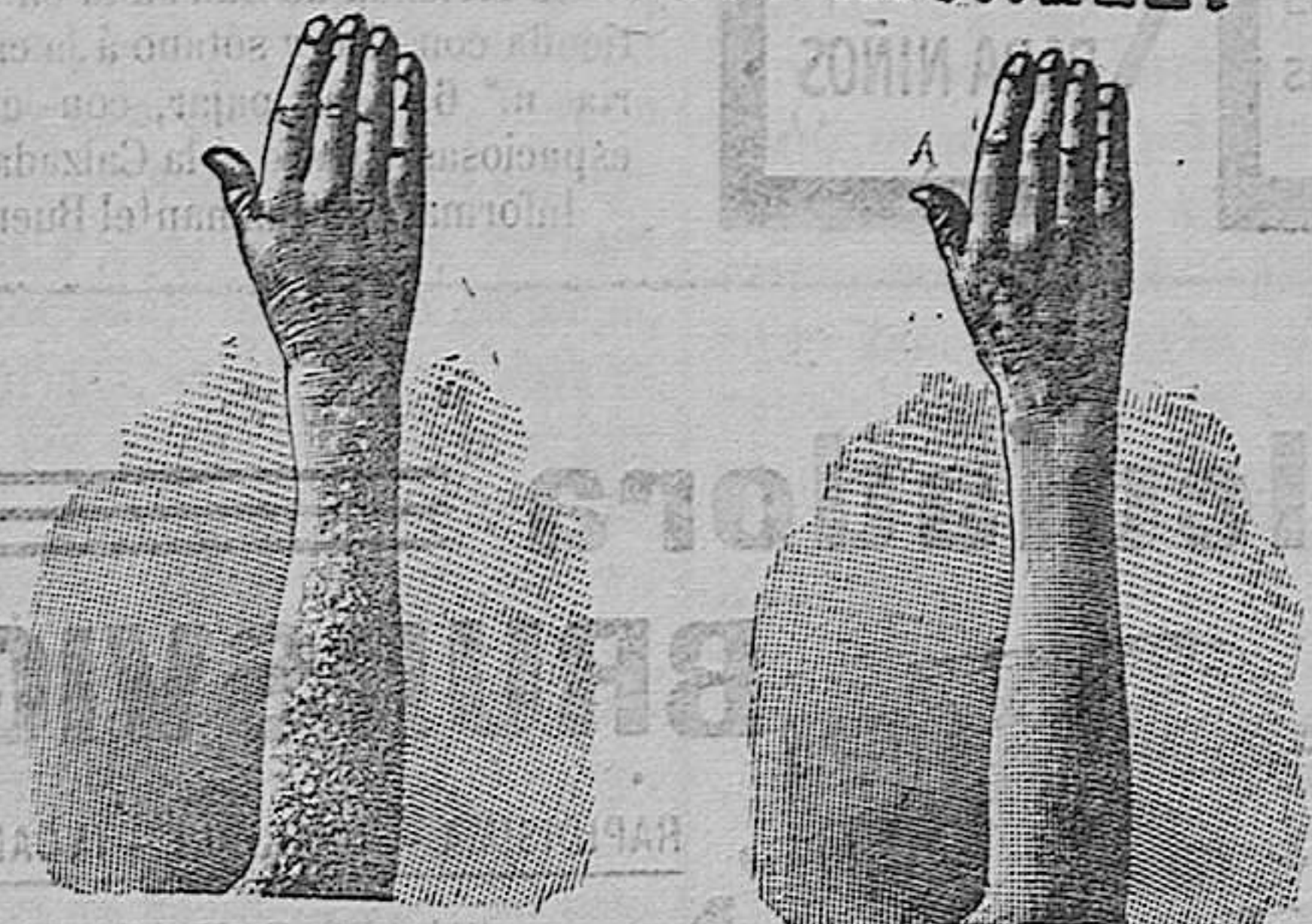
Antes de la curacion