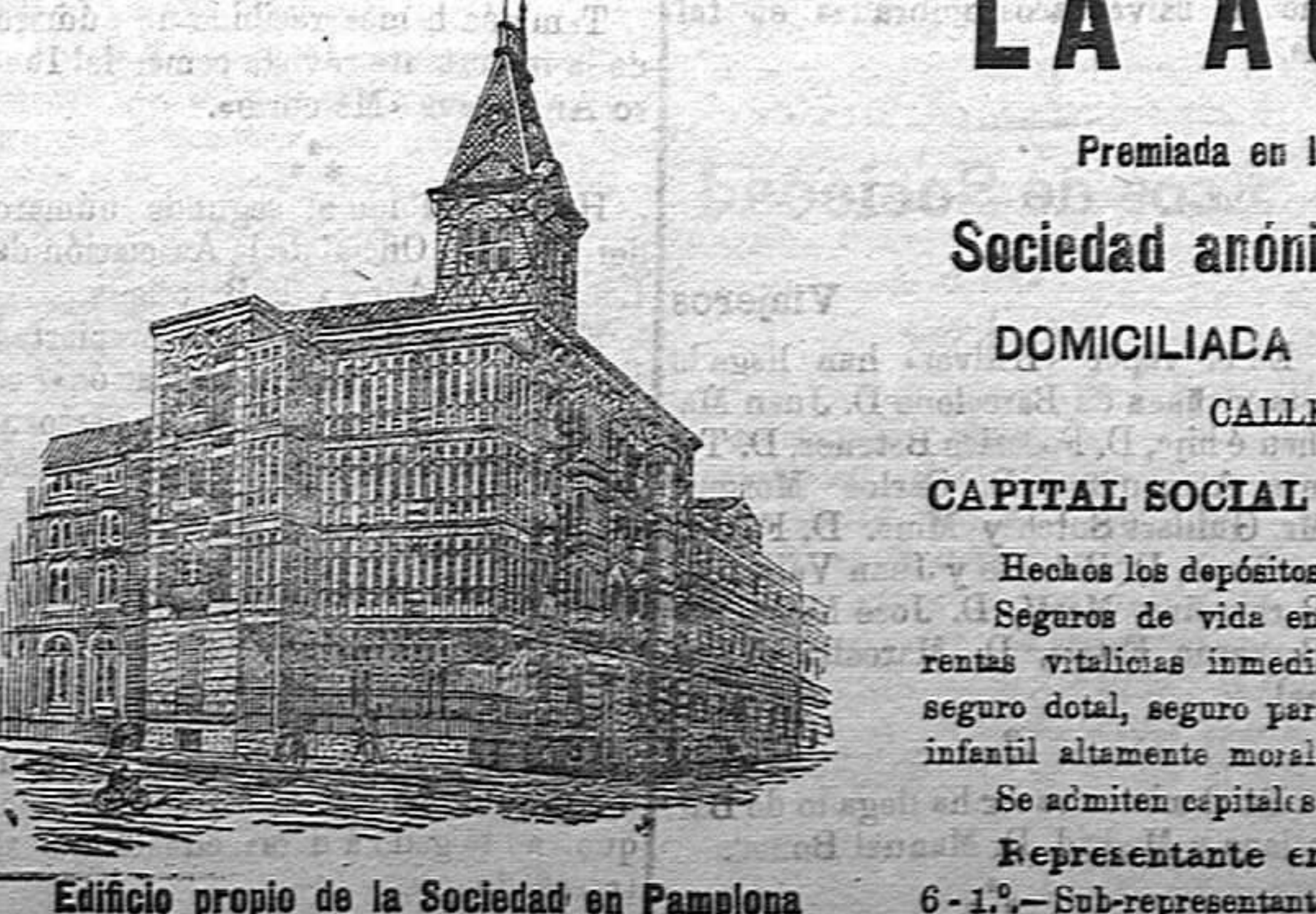
Edificio propio de la Sociedad en Pamplona

Para más informes: Droguería de Miguel Bestard—Plaza Cuartera, 2