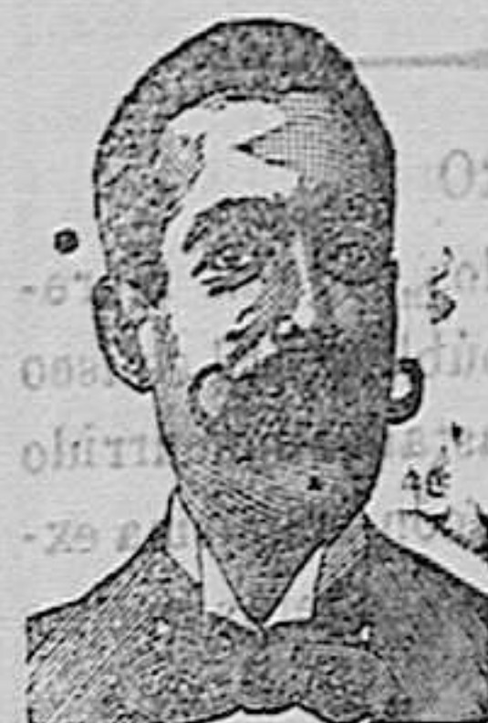
A. SALVATI COSTANZI Calle Diputacion, 435 BARCELONA.

EMULSION NADAL con 80 por 100 aceite puro hígado bacalao y glicero-fosfatos é hipofosfitos de cal y sosa. Aprobada y recomendada por el Colegio Médico oficial de Barcelona y analizada por el Dr. Bonet, Catedrático de Farmacia en la Universidad de Madrid. Es alimento, golosina y medicamento tónico y estimulante del desarrollo físico; aumenta la secrecion láctea; ayuda al crecimiento de los huesos y salida de los dientes; de efectos positivos en las embarazadas y en la infancia. Es crema fluida, blanquísima y la mas agradable (se conserva siempre). Cura la tos, catarros, bronquitis, tisis, escrófulas, linfatismo, raquitismo, debilidad, gota, reumatismo, diabetes, etc., etc. De venta en las principales Farmacias. Depósitos: En Leon, Plaza, Velasco y Compañía, y M. Nadal, ES LA MEJOR en Tarragona.