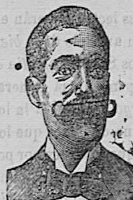
A. SALVATI COSTANZI Calle Diputacion, 435 BARCELONA.

Purgativos, Depurativos y Antisépticos Contra el ESTREÑIMIENTO y sus consecuencias: JAQUECA - MALESTAR - PESADEZ GÁSTRICA CONGESTIONES - ENFERMEDADES INFECCIOSAS Exíjase el Rófalo adjunto en 4 Colores. Paris, F o LEROY, 91, Rue des Petits-Champs y todas Farm as .