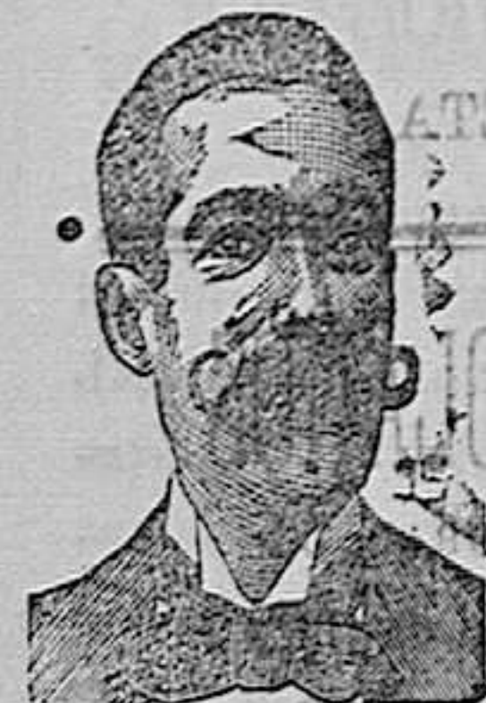
A. SALVATI COSTANZI Calle Diputación, 435 BARCELONA.

CONFITES ANTIVENÉREOS Y ROOB ANTISIFILITICOS COSTANZI