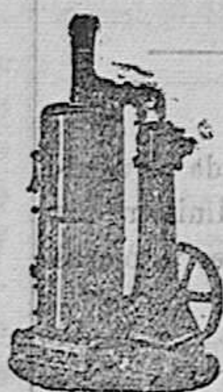
en agujas á vapor vertical

Maquinas de vapor, Bombas, Prensas, Tubos de todas clases