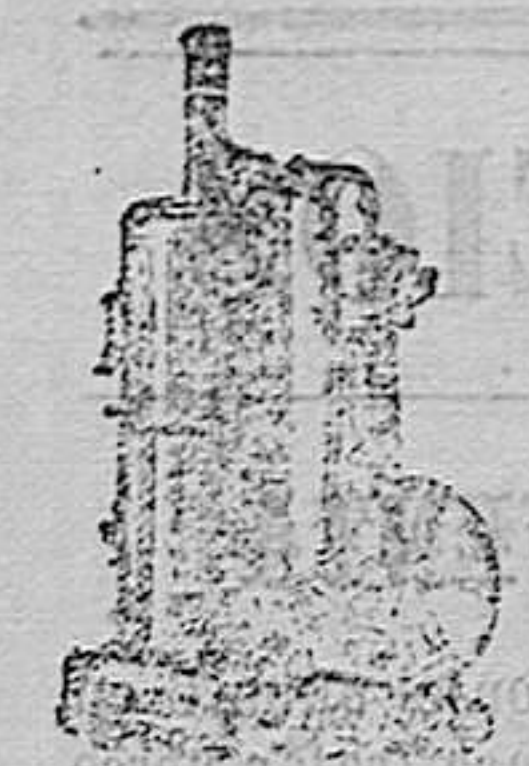
maquinas d vapor vertical