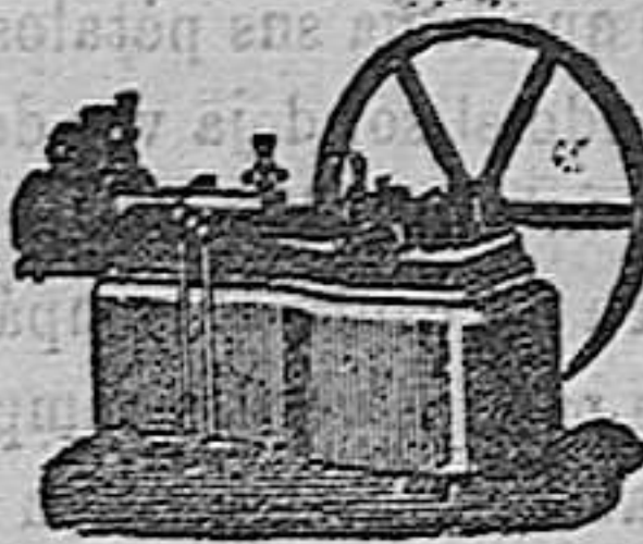
Máquina de vapor Horizontal.

Catálogos gratis y francos á quien los pida.