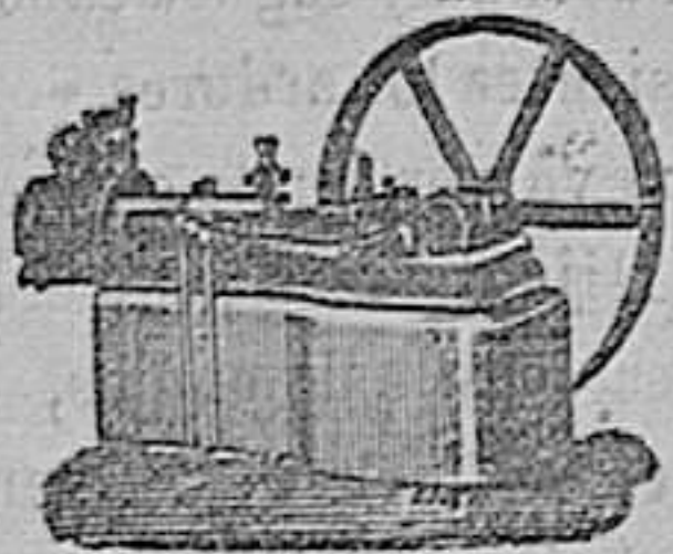
Máquina de vapor Horizontal.