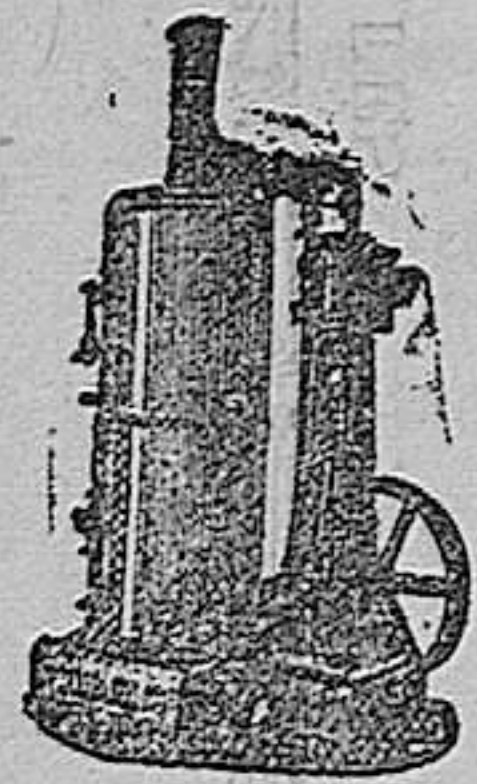
maquina de vapor vertical

Maquinas de vapor, Bombas, Prensas, Tubos de todas clases