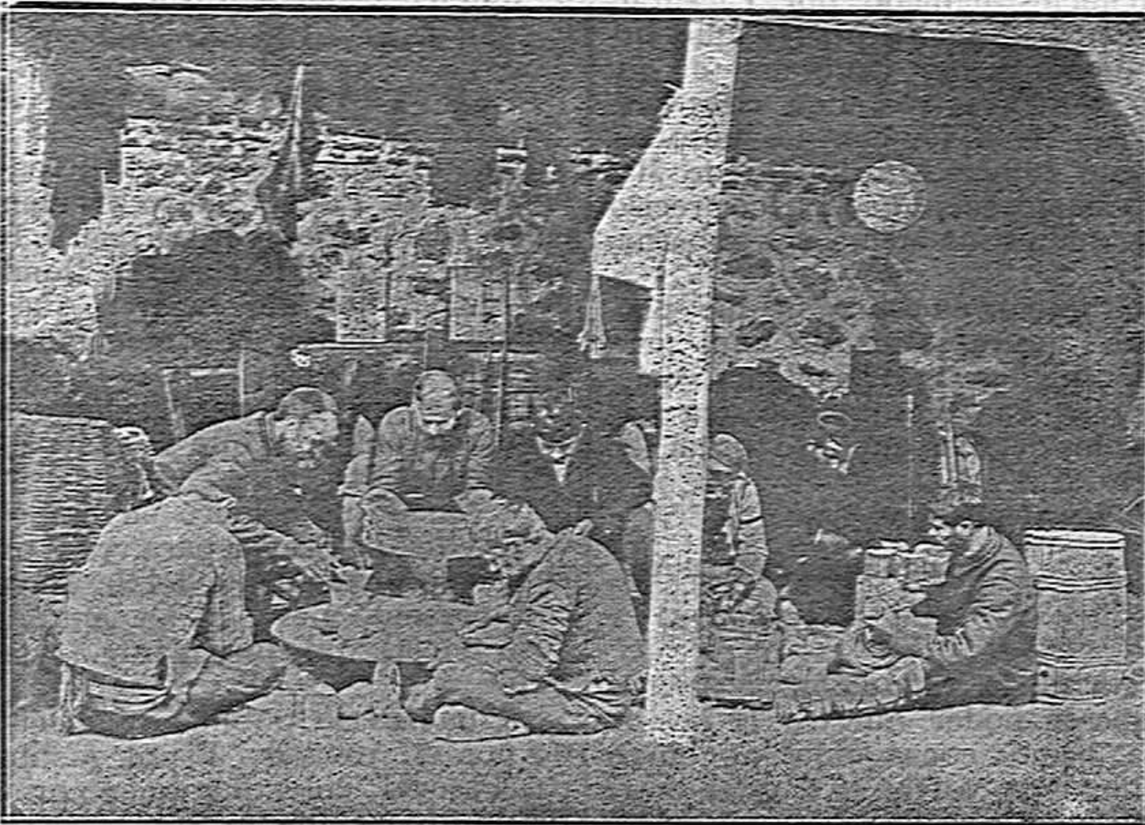
Voluntarios búlgaros preparando municiones y bombas de mano