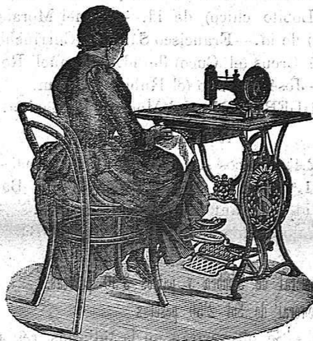
Nuevo, Práctico Higiénico