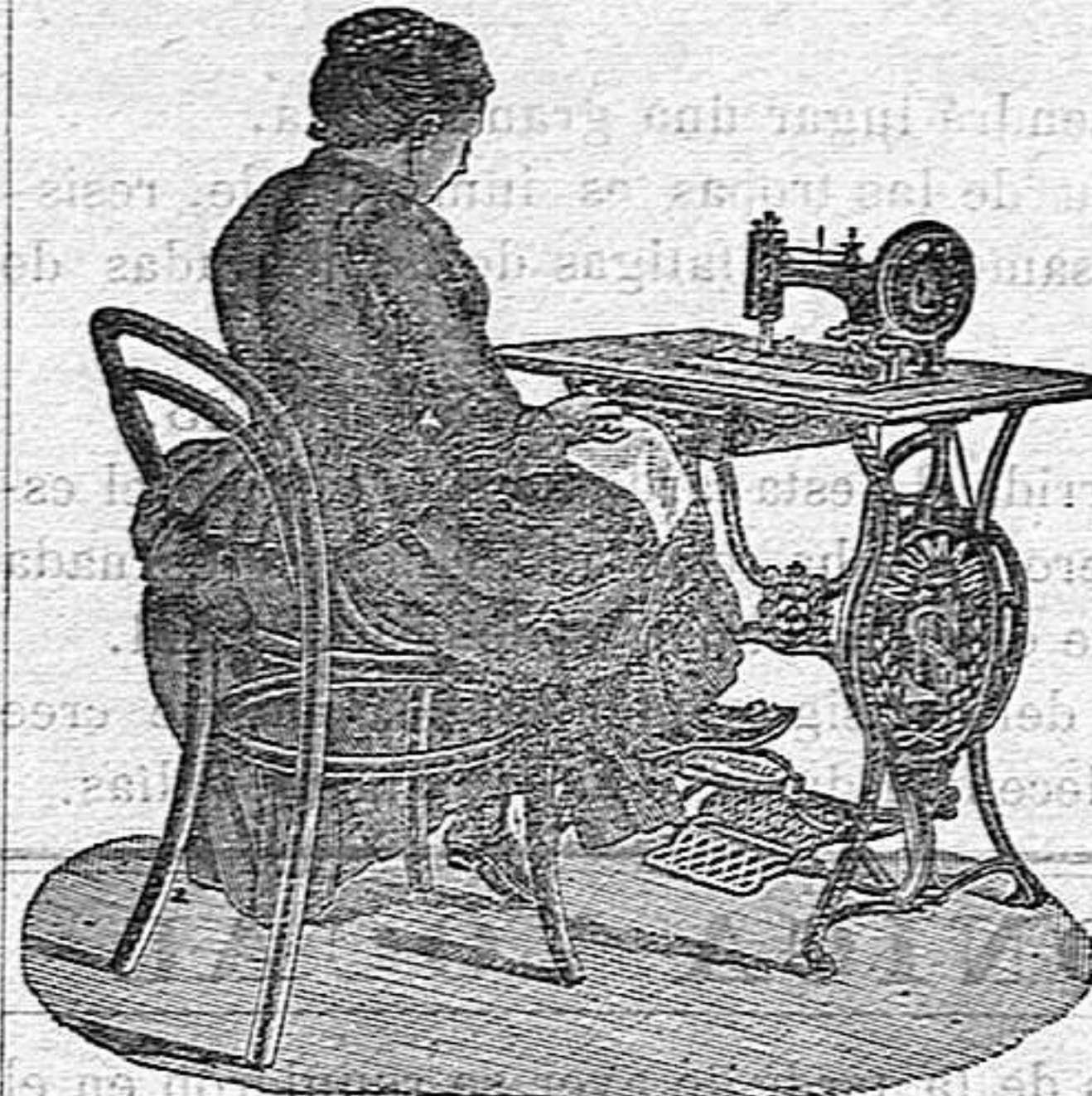
Nuevo, Práctico, Higiénico