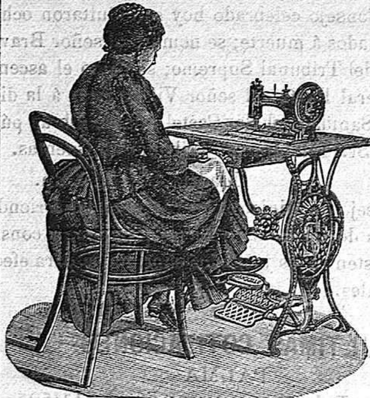
Nuevo, Práctico, Higiénico