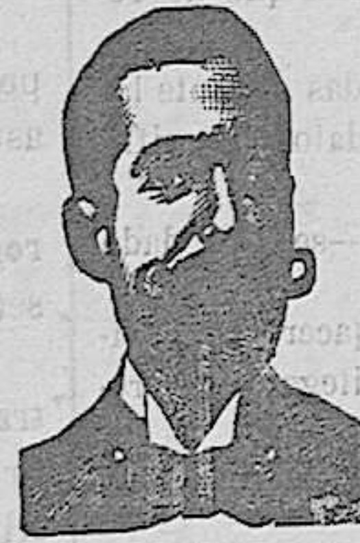
Salvador Costanzi Diputación, 435 Barcelona

Emulsión Nadal (ES LA MEJOR Y MAS AGRADABLE). Con 80 por 100 aceite higado bacalao y glicerofosfatos é hipofosfitos. La recomienda Colegio Médico de Barcelona; analizada por el Dr. Bonet, Catedrático de la Facultad de Farmacia de Madrid. Cura la tos, catarros, bronquitis, tisis, escrófulas, linfanismo, raquitismo, debilidad, dolores, diabetes, etc. Alimento, golosina, medicamento tónico; estimula el desarrollo físico, el crecimiento de los huesos y salida de los dientes; indispensable á las embarazadas y niños, aumenta la secreción de la leche y el vigor. Crema fluida blanquísima é inalterable.—De venta en las farmacias.