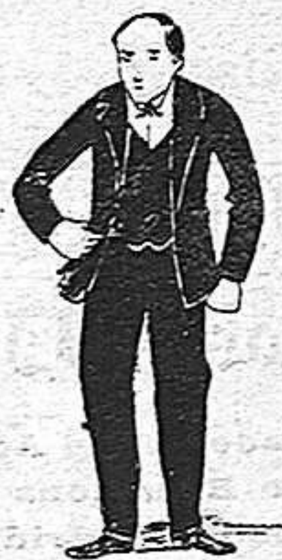
(Reflexions d'un ciurranista)