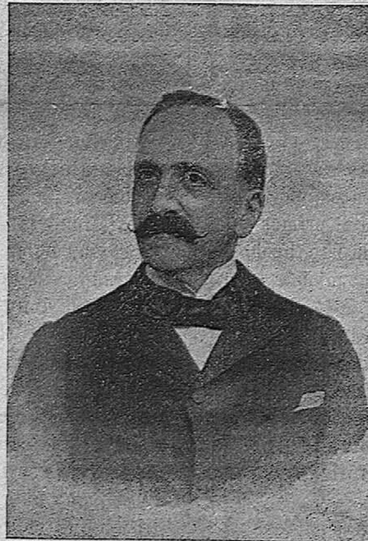
D. JOSÉ MURO Y CARRATALÁ

Proclamado Diputado por este distrito en 12 de Abril del año anterior, ha alcanzado en el breve espacio de tiempo que desde aquella fecha ha transcurrido, mejoras y reformas importantes, siempre anheladas y nunca conseguidas, en cuya realización ha evidenciado el ascendiente de que en la Corte goza y que, cual ofreció, ha puesto sin cesar al servicio del Distrito su laboriosidad, su talento y sus prestigios.