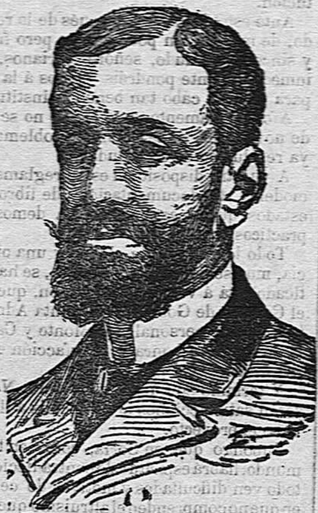
Excmo. Sr. D. Miguel Villanueva nuevo ministro de Fomento.