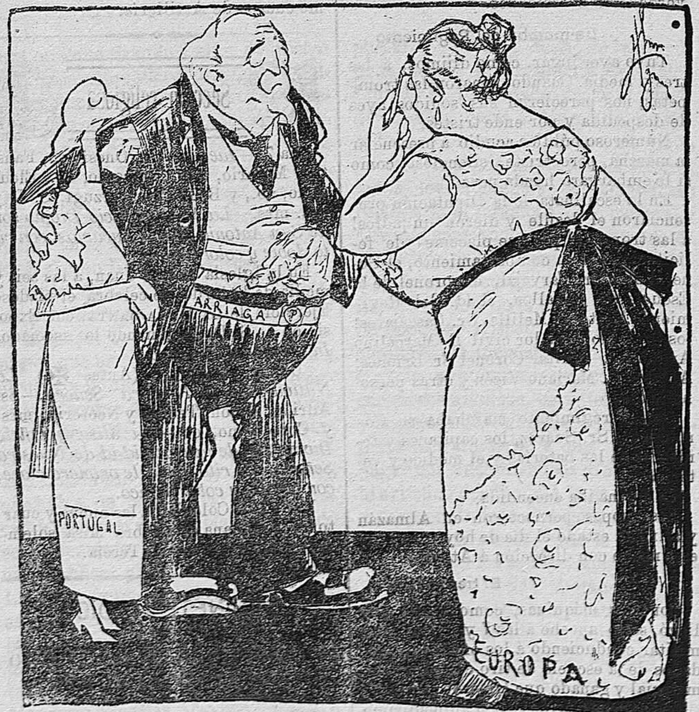
Arriaga.—Señora, tengo el gusto de presentar la..... Europa.—Bien, bien; pero á usted ¿quién le presenta?