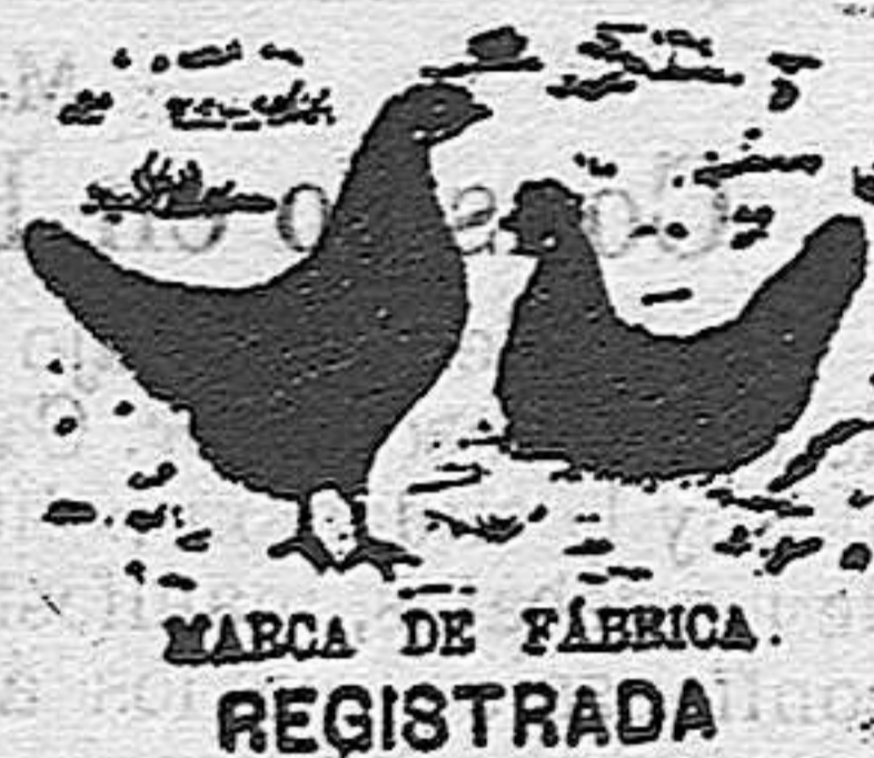
MARCA DE FÁBRICA REGISTRADA