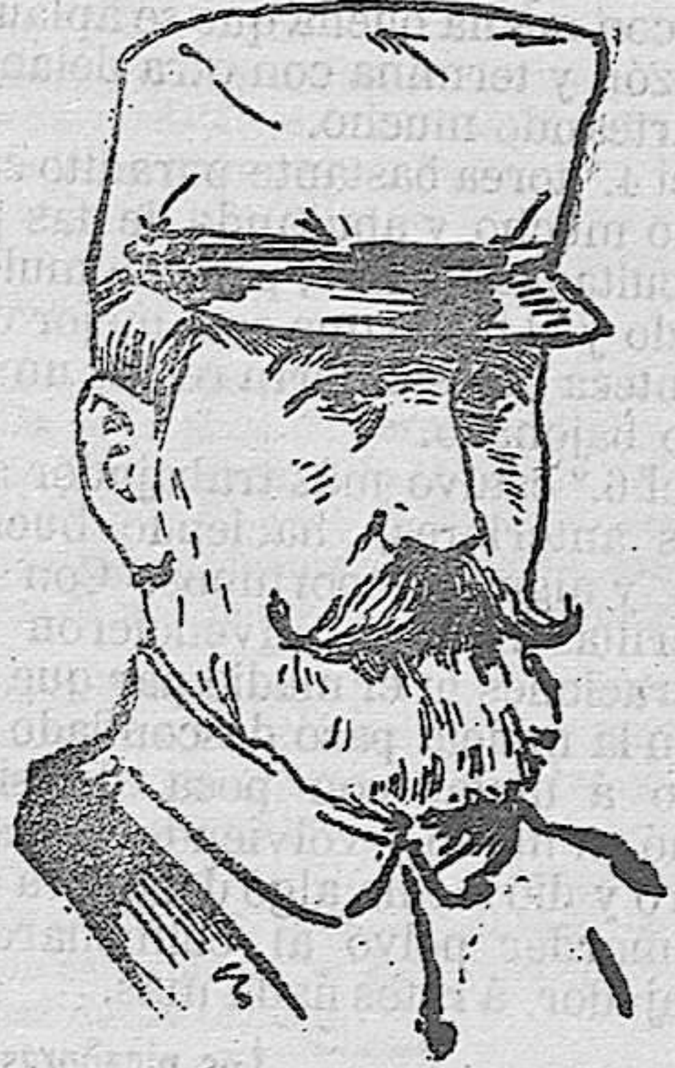
El general D. Darío Díez Vicario

Muerto en el combate de los montes de Beni-Bu-Ifror.