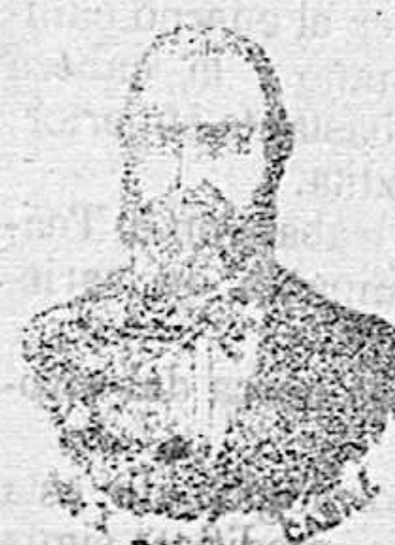
Inventor de los renombrados medicamentos CASILE Diputación 435 BARCELONA

Nota—Cambiamos todo género que salga malo.