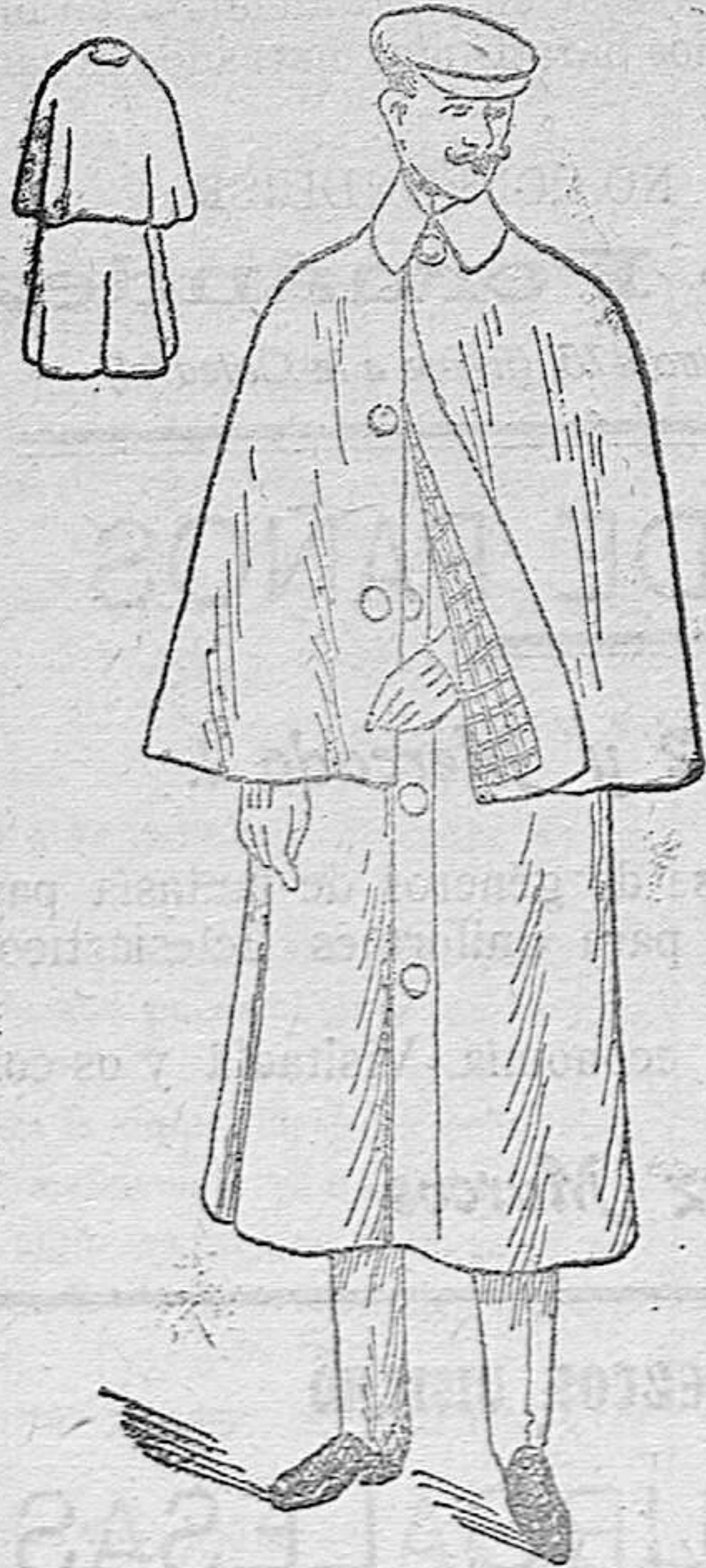
Impermeable Calidad Superior, a 100 - 110 y 121 pesetas.