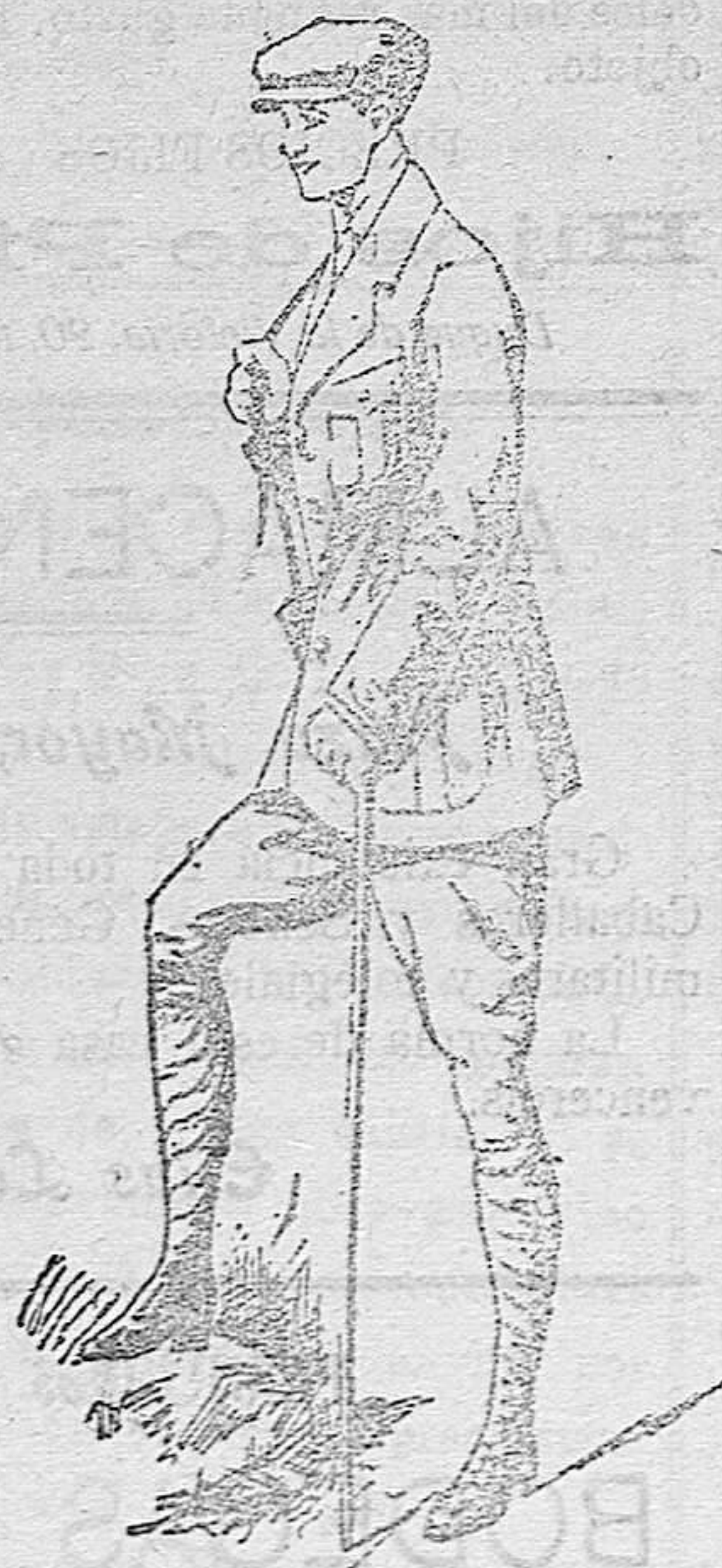
Trajes Paño Espor a 50 - 60 y 70 pesetas Lana Espor a 45 - 50 y 60 »

Enterizos para mecánicos y Motoristas, a 20 - 22 - 25 y 30 pesetas.