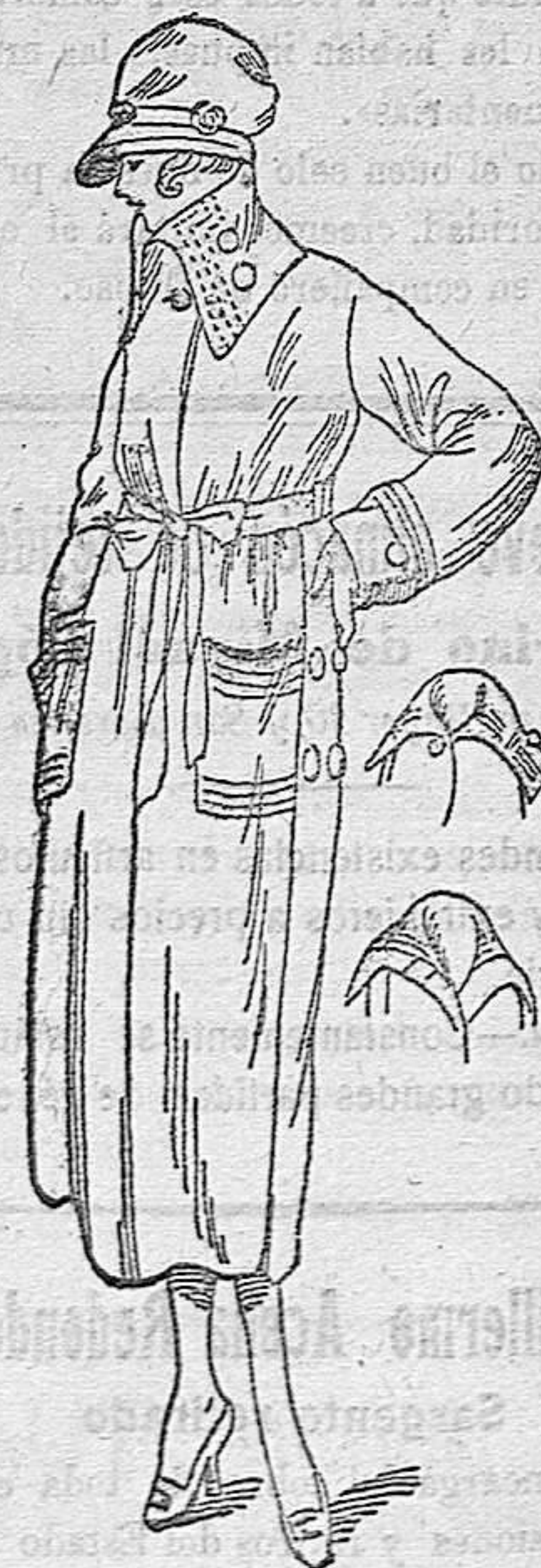
Cabardinas de Señora bonitos modelo a 110 - 120 y 135 pesetas.