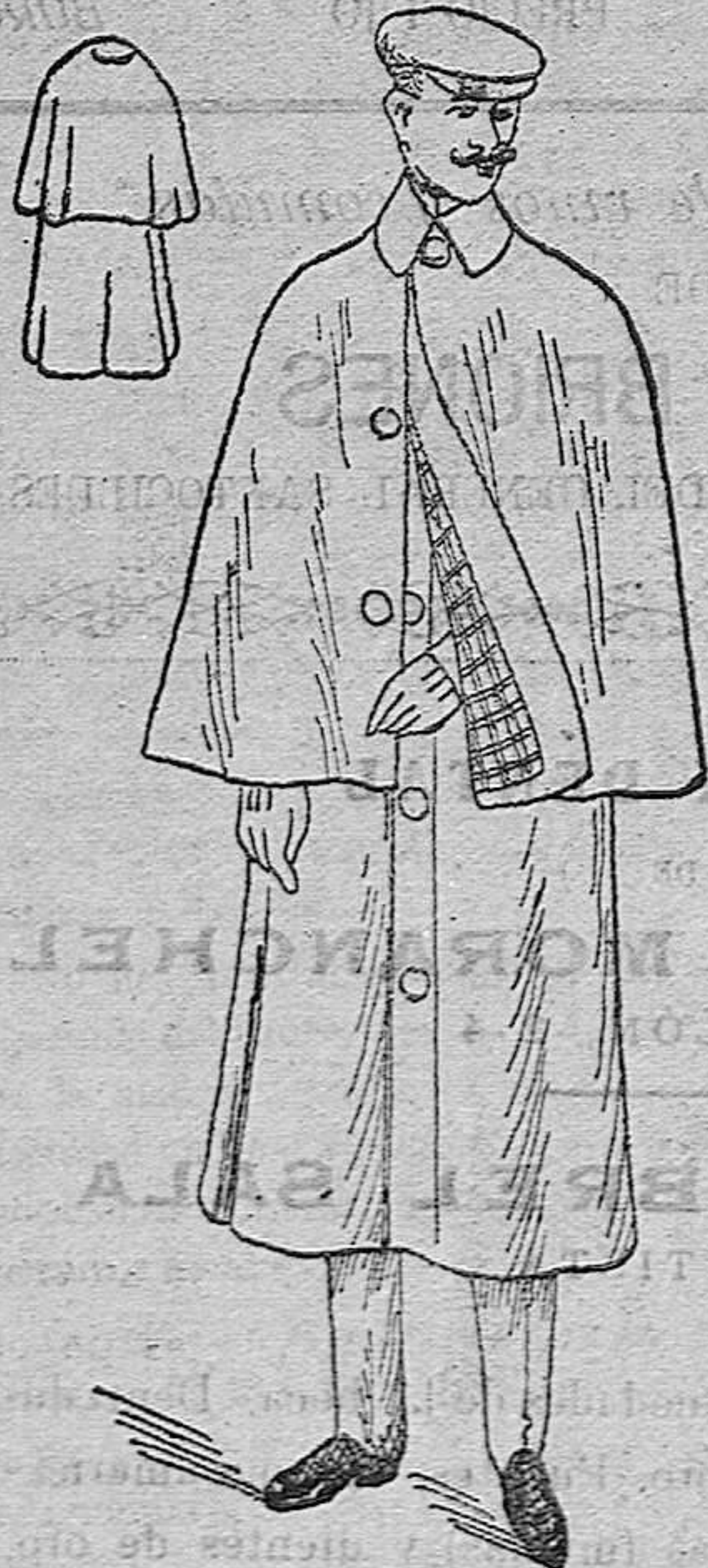
Impermeable Calidad Superior, a 100 - 110 y 121 pesetas.

Grandes Surtidos en trajes económicos en azul tina y driles.