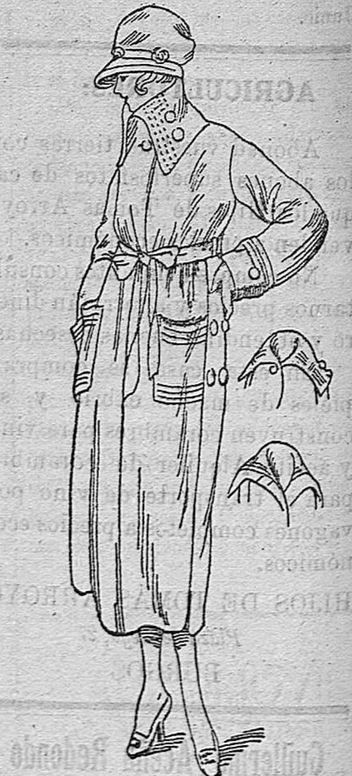
Gabardinas de Señora bonitos modelos, a 110 - 120 y 135 pesetas.