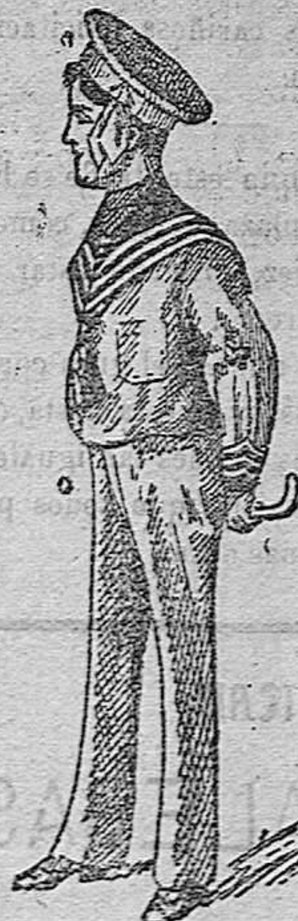
Trajecitos Dril en blanco y listados, a 8 - 10 - 15 - 20 - 25 y 30 pesetas.