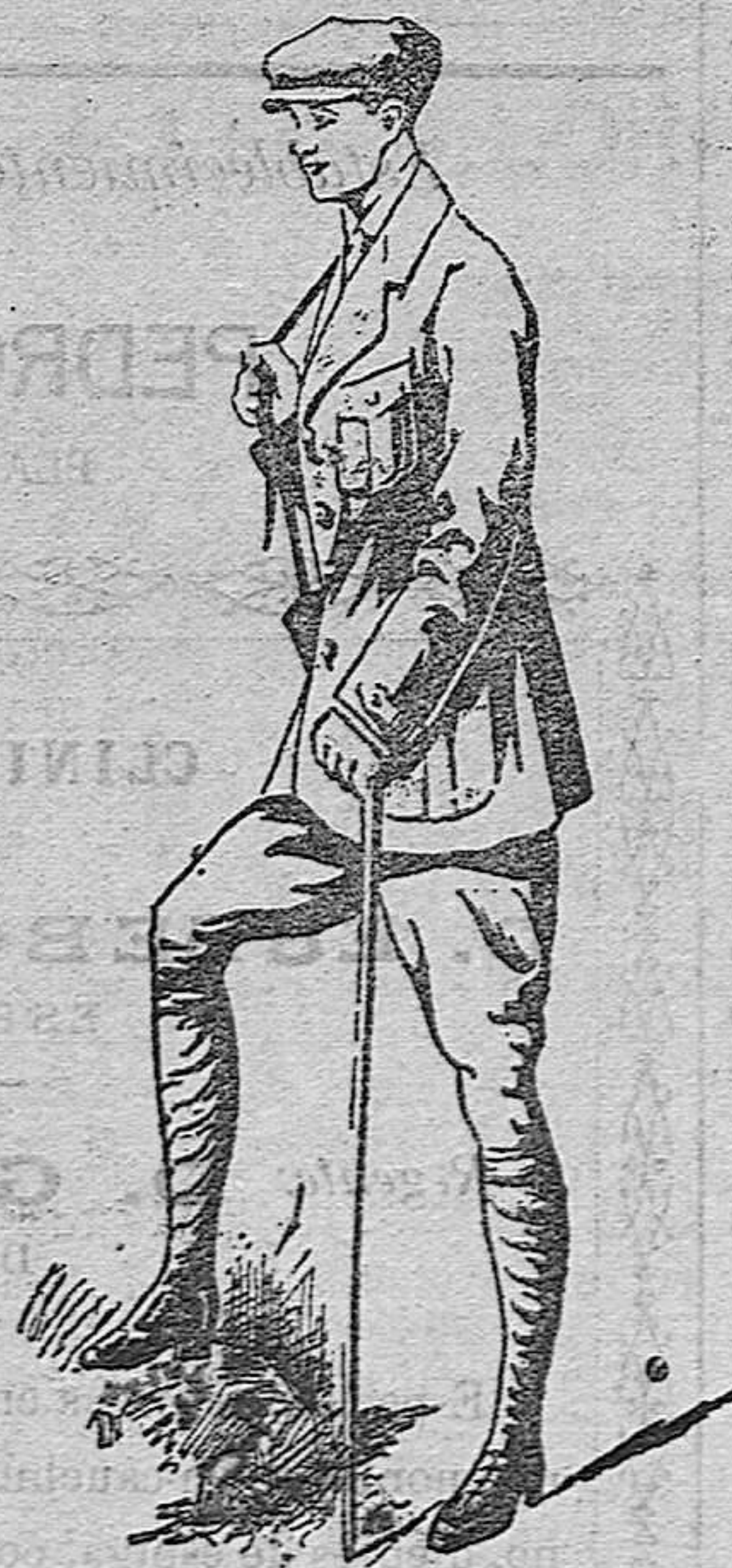
Trajes Dril Sport a 30 - 35 y 45 pesetas. París Sport a 45 - 50 y 60 »