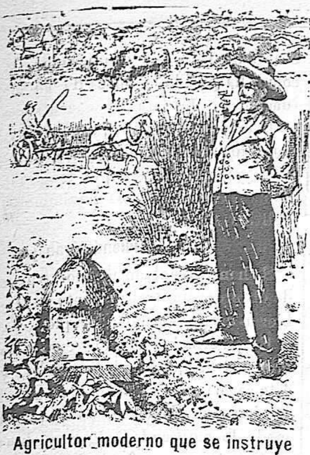
Agricultor moderno que se instruye