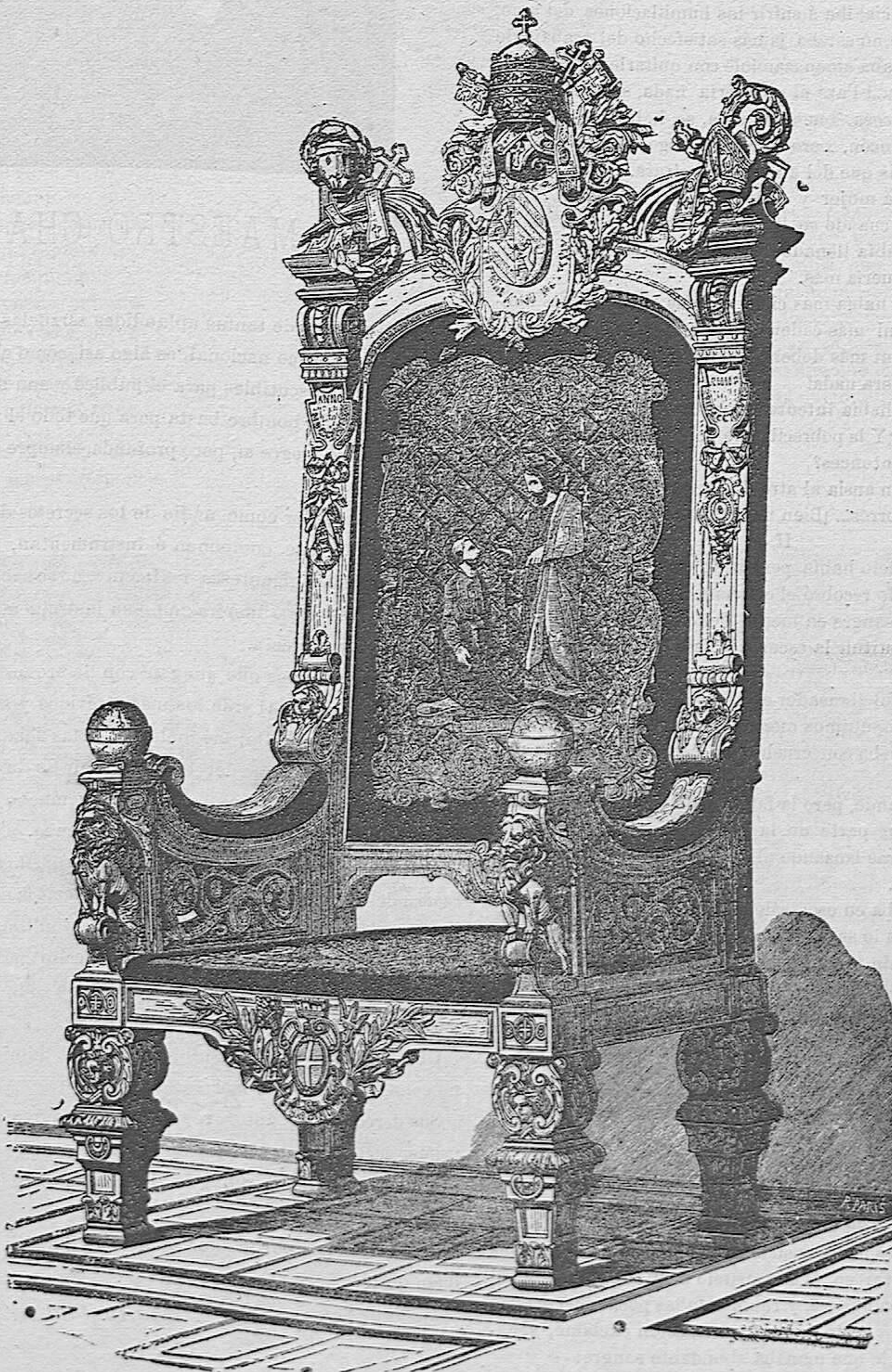
SILLA DE SU SANTIDAD LEON XIII.