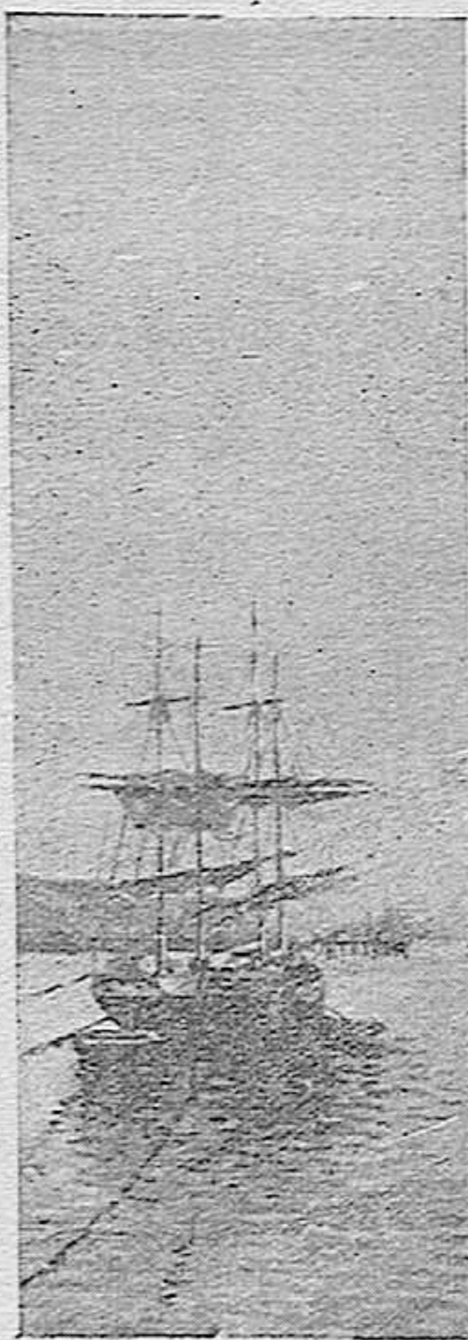
MARINA Por E. Figuer.

..... Pon al retrato mío negros crespones