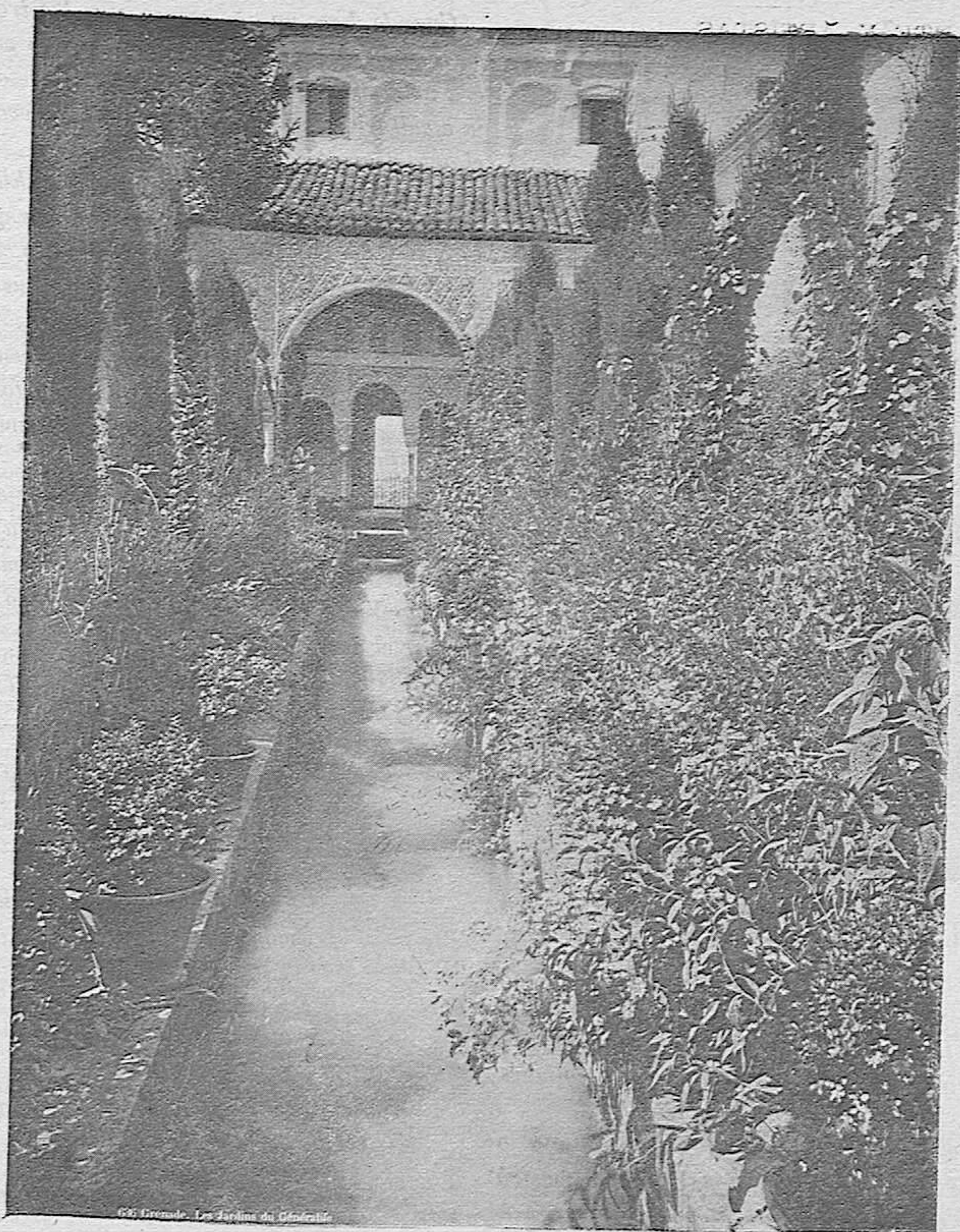
GRANADA.—Patio del Generalife.