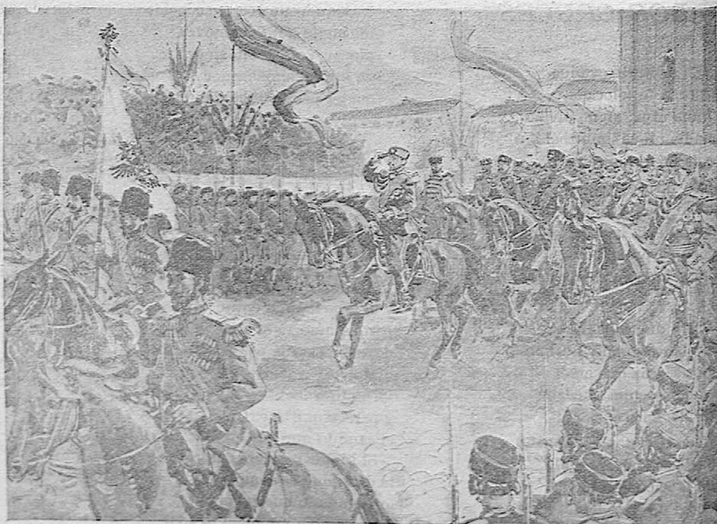
El Czar Nicolás II revistando tropas en San Petersburgo.