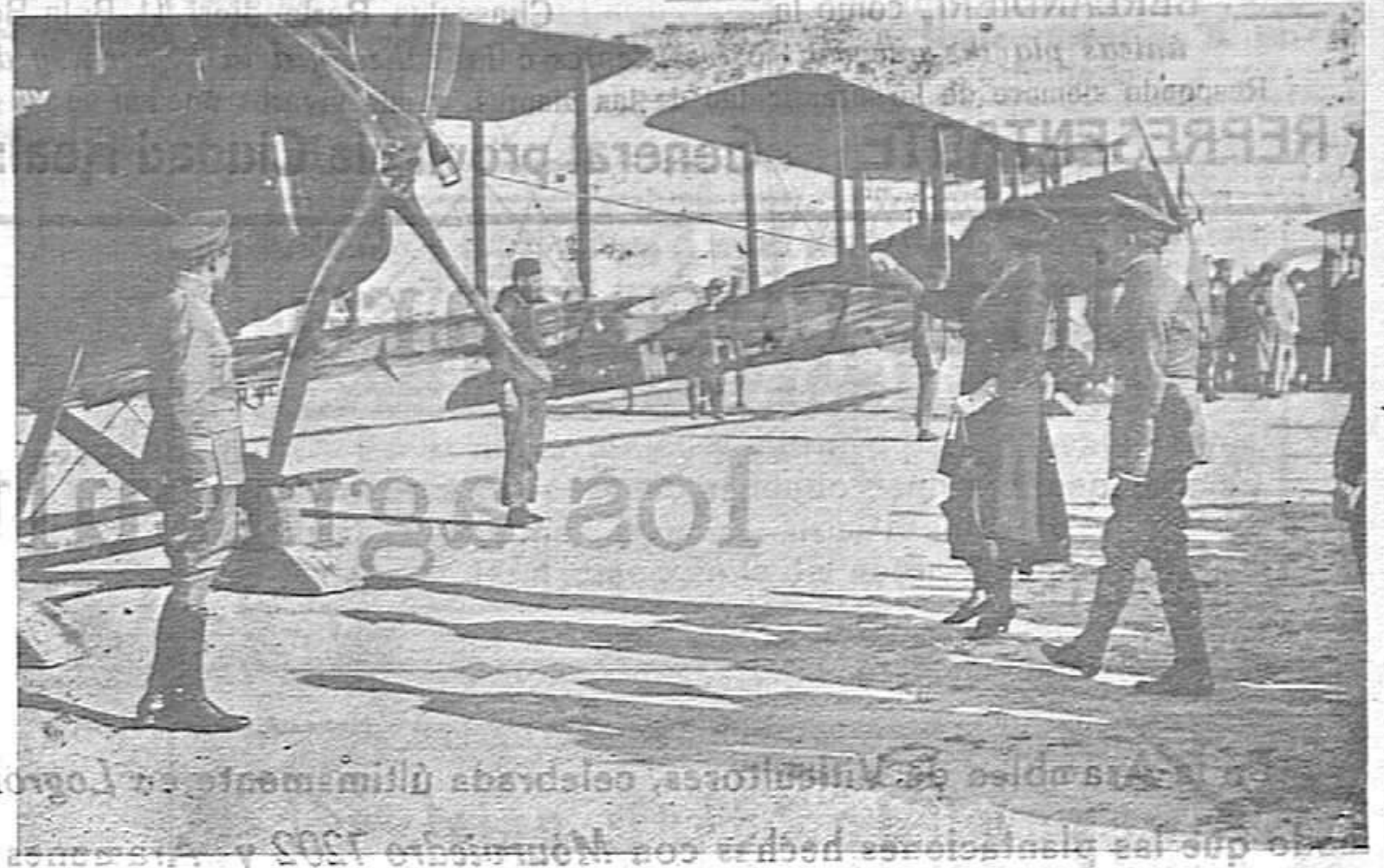
La Reina bautiza el «SALAMANCA» núm. 1

A la primera de ellas asistieron los Reyes y la Infanta doña Isabel; a la segunda, celebrada dos días después, asistió solamente el ministro de la Guerra. En la primera se entregaron los dos aeroplanos de Zaragoza y los dos de Salamanca. Bendijo los aparatos el obispo de las diócesis salmantina y fueron madras de los aviones; S. M. la Reina del «Salamanca núm. 1»; S. A. R. la Infanta D. a Isabel del «Salamanca núm. 2»; del «Zaragoza número 1», la señora del ministro de la Guerra; del «Zaragoza número 2», la del ministro de la Gobernación. De los tres aparatos de Murcia se entregaron dos, que bendijo el obispo de Sión y que «amadrinó», la señora de D. Juan La Cierva.