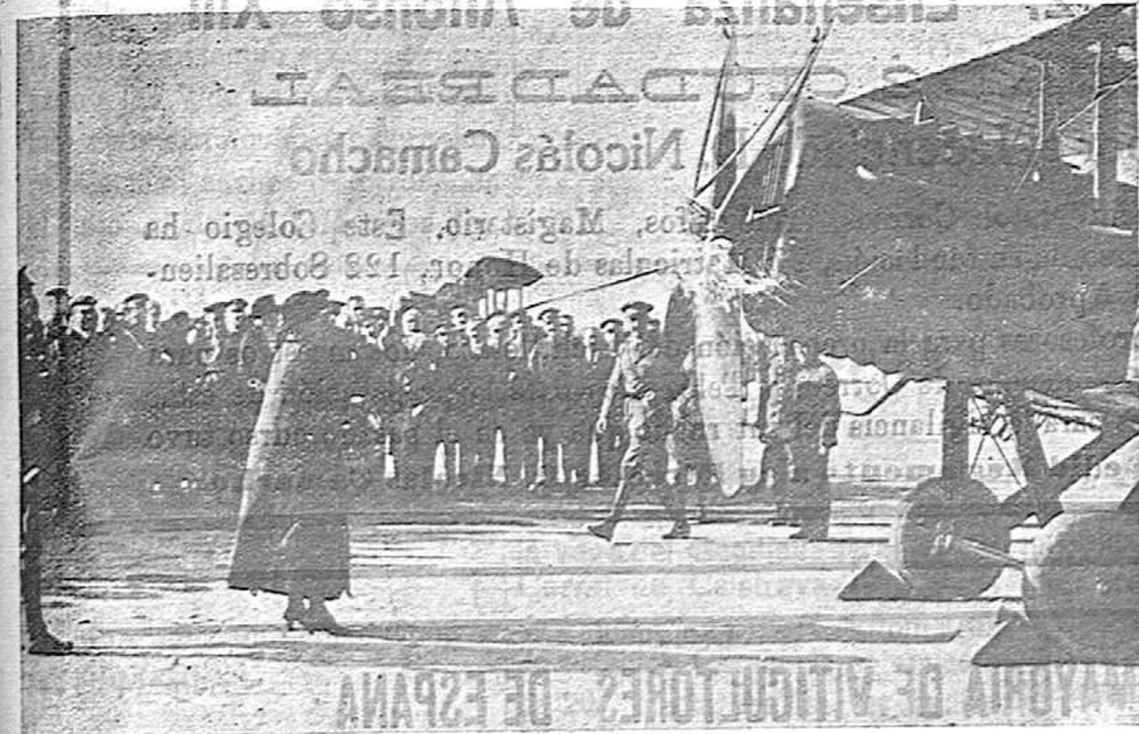
La señora de Coello bautiza el «Zaragoza núm. 1».

apareto elegido. Al siguiente día el cheque, Total, setenta y dos horas. Y bueno será, que digamos que cuando, días después, buscamos en las columnas de «La Vanguardia», de Barcelona, la noticia relativa al avión de ese nombre, a duras penas logramos hallar en un rincón de una plana, sin relieve tipográfico de ningún género, «doce» líneas dedicadas a dar cuenta del do-