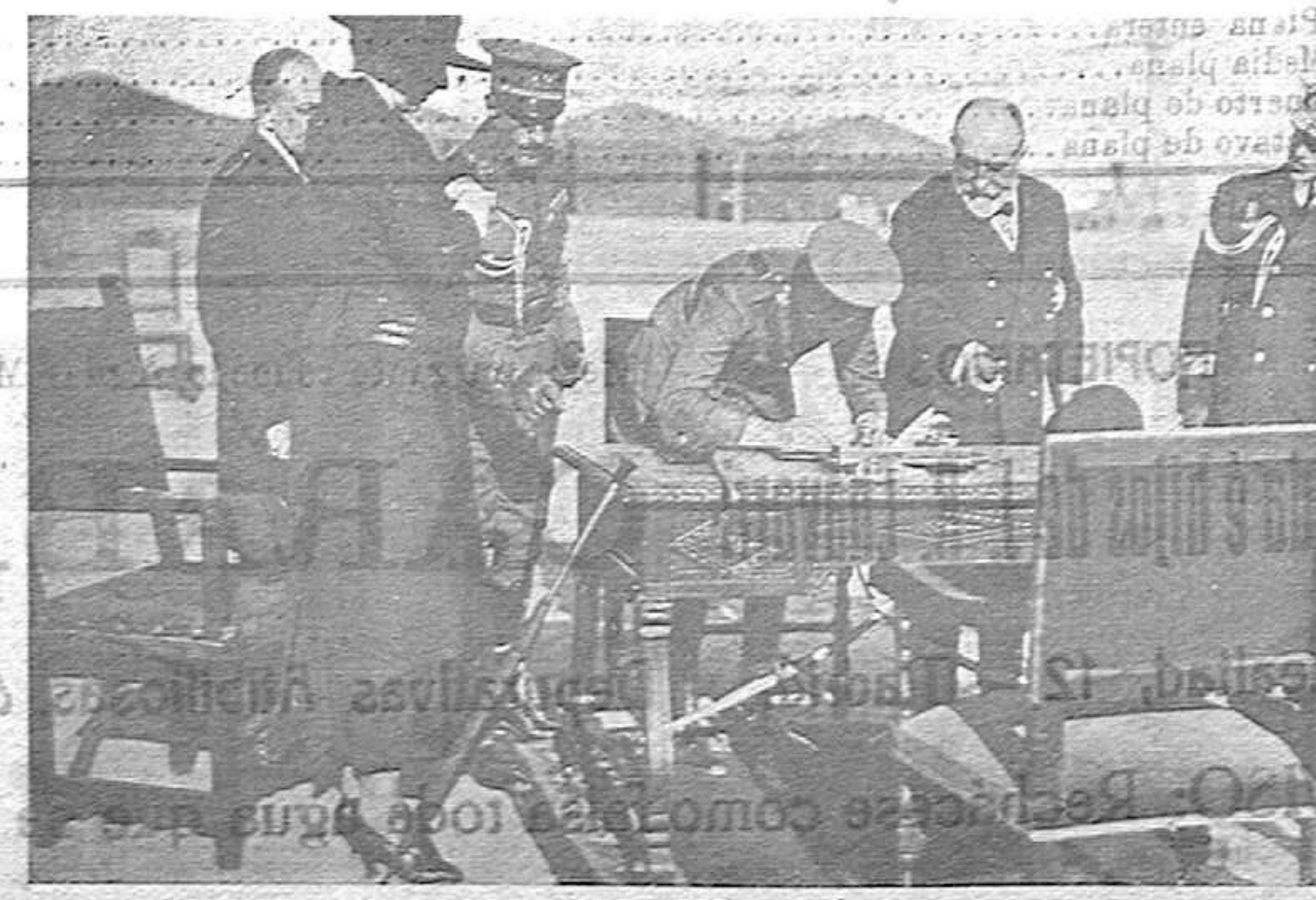
La firma del acta de entrega.