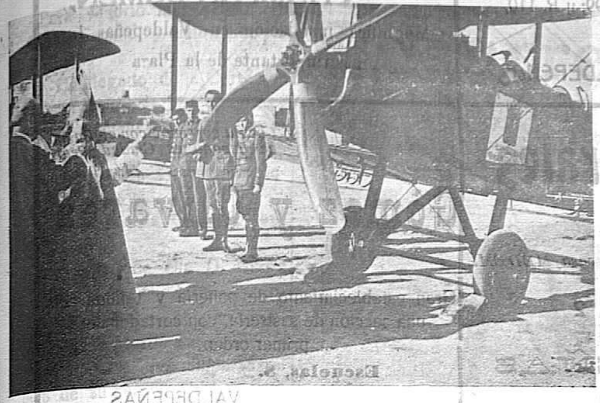
Bendición de aparatos

Tomamos del Heraldo Deportivo , el siguiente artículo de nuestro camarada Ruiz Ferry. La iniciativa que surgió un día en Murcia, y que fué secundada inmediatamente por algunas provincias y entidades, ha producido a la hora presente una lista bastante copiosa de «Aeroplanos del pueblo». No todos son precisamente «del pueblo», pero están éstos en mayoría. Según los datos que la Co-