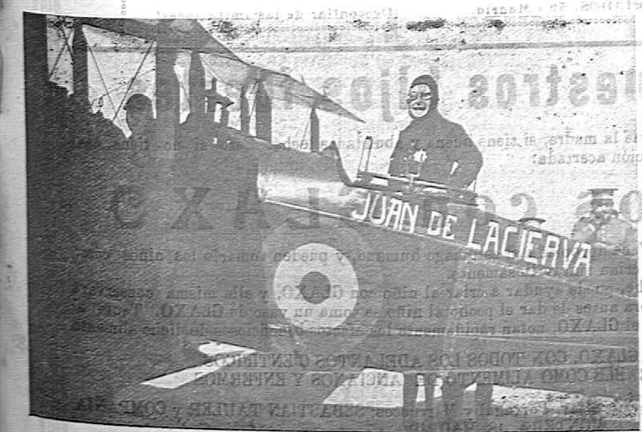
El ministro de la Guerra, recibe el bautismo del aire.

nativo; 62.000 francos por 12 líneas es también un «record». Es muy doloroso que la iniciativa patriótica haya tenido que venir a suplir los olvidos y maquineries de los hacedores de presupuestos. En apariencia, el pueblo va a pagar dos veces lo que debió pagar tan sólo una; mejor dicho, lo que pagó, en efecto, si bien las complicaciones administrativas llevaron a capítulos distintos recursos que demandaba como preferentísima necesidad la Aviación militar. Por fortuna, esta «segunda vez» ha dado aeroplanos en lugar de dar dinero. Sin ánimo de molestar a nadie, felicitemos al pueblo por su prudencia. R. RUIZ FERRY.