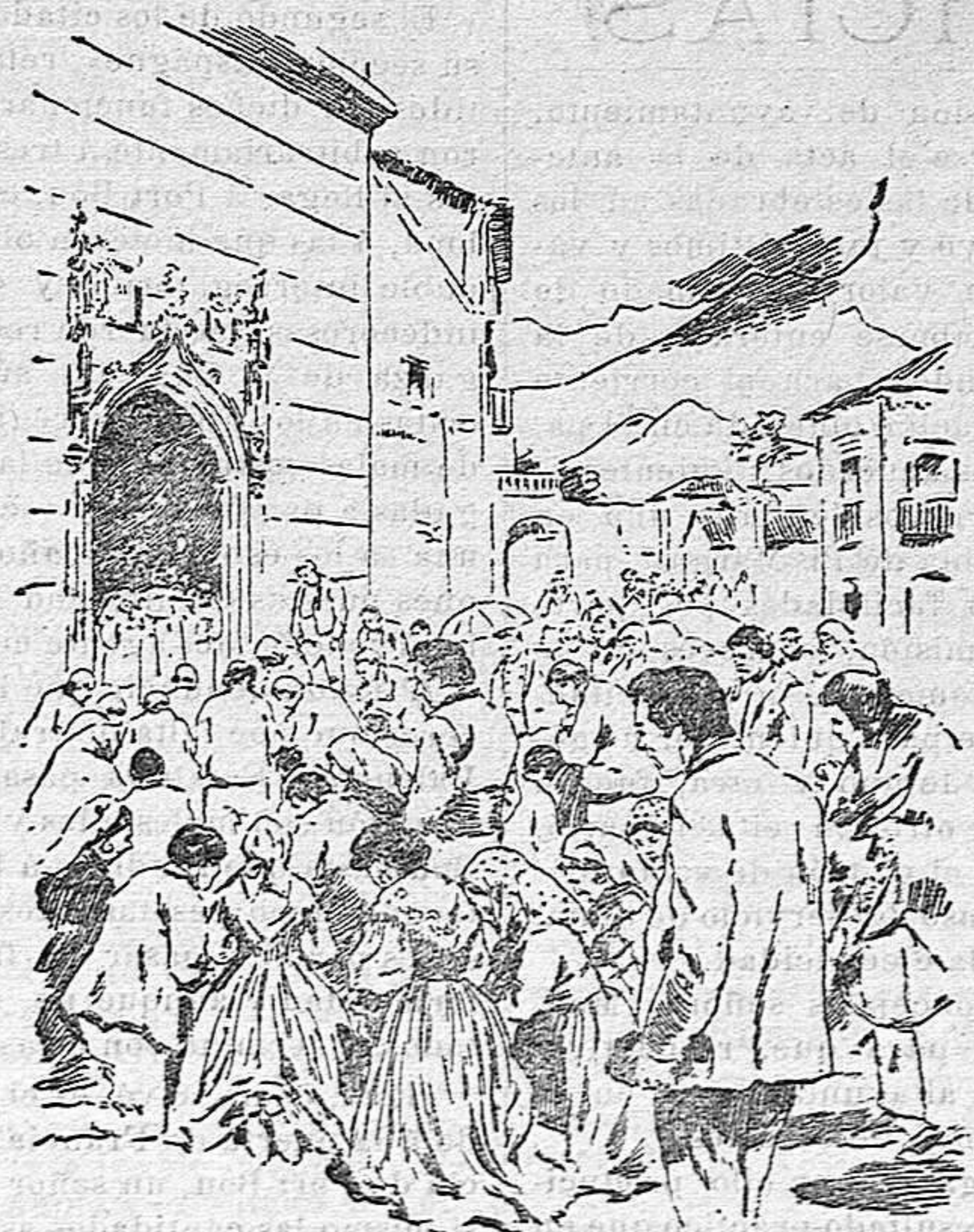
Campesinos de Catania sacando en procesion al Santísimo para aplacar la violencia del Etna

Una nueva y terrible erupción de uno de los cráteres del Etna, el de Nicolosi, vuelve á dar actualidad tristísima al famoso volcán siciliano.