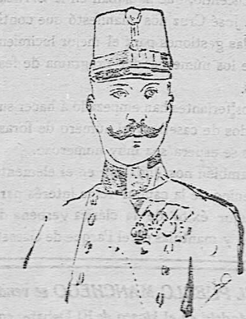
El general austro-húngaro Bohem Ermail, comandante del ejército austro-alemán que ha recobrado Tarnopol y se halla próximo á la frontera oriental de la Galitzia

Lo que no se dice, por desgracia, es que la policía haya logrado echar el guante á esos profesionales del alboroto y del motín, á sueldo de ciertas naciones extranjeras que tienen decidido empeño en sacarnos de nuestras casillas.»