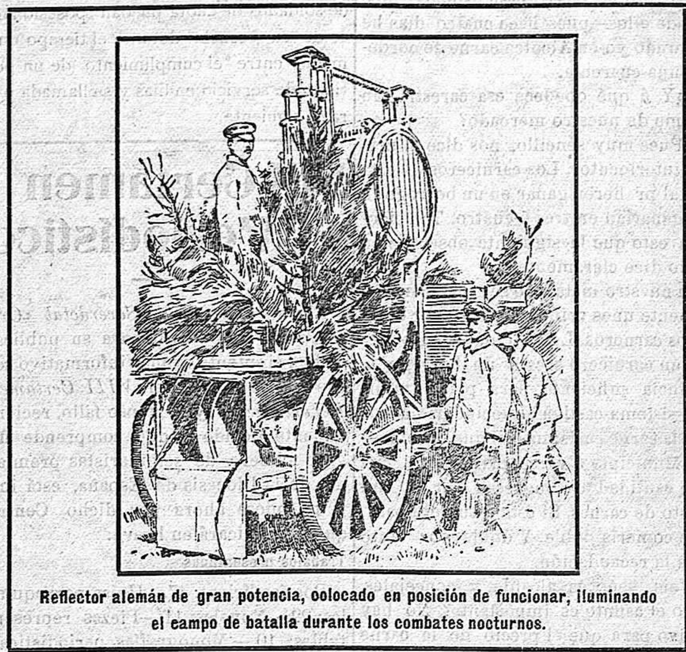
Reflector alemán de gran potencia, colocado en posición de funcionar, iluminando el campo de batalla durante los combates nocturnos.

Mañana, á las seis y media y á las nueve y media. Cine. La incomparable película «Salambó».