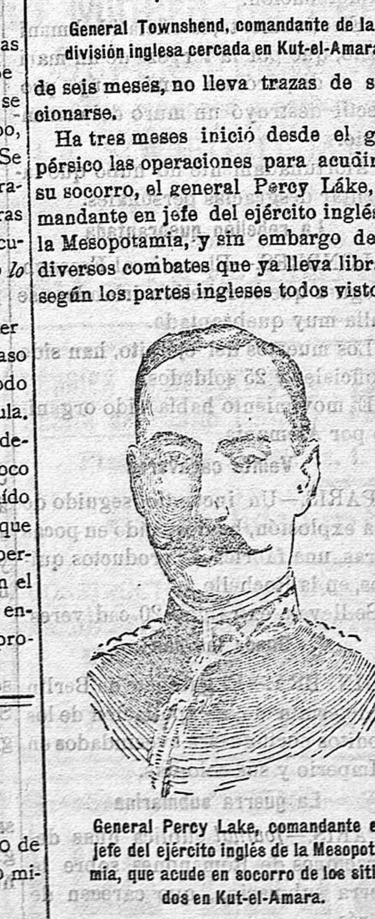
General Percy Lake, comandante en jefe del ejército inglés de la Mesopotamia, que acude en socorro de los sitiados en Kut-el-Amara.

legar á Kut-el-Amara, empresa en que si sale triunfante no será sino á costa de grandes esfuerzos y abundante sangre porque dichas posiciones no pueden ser envueltas por apoyarse en el Tigris y en pantanos. La situación del general Townshend y de las tropas anglo-indias de su mando debe ser en extremo crítica, no solo porque los combates han debido disminuir su contingente, sino porque sus posiciones de boca y guerra deben estar casi agotadas después de más de seis meses de asedio. Los aviadores ingleses han llevado á los sitiados semillas de hortalizas para que pudieran sembrar y de este modo procurarse alimento; pero esto no habrá pasado de ser un paliativo de poca importancia. Ultimamente se ha intentado hacer llegar á los sitiados un barco de provisiones, pero este no ha llegado á hacer la mitad del recorrido y ha embarrancado en un racodo de la orilla derecha del Tigris. ¿Logrará el general Lake abrirse paso hasta Kut-el-Amara? Y si lo consigue ¿llegará á tiempo para salvar los restos de la división Dowshend?