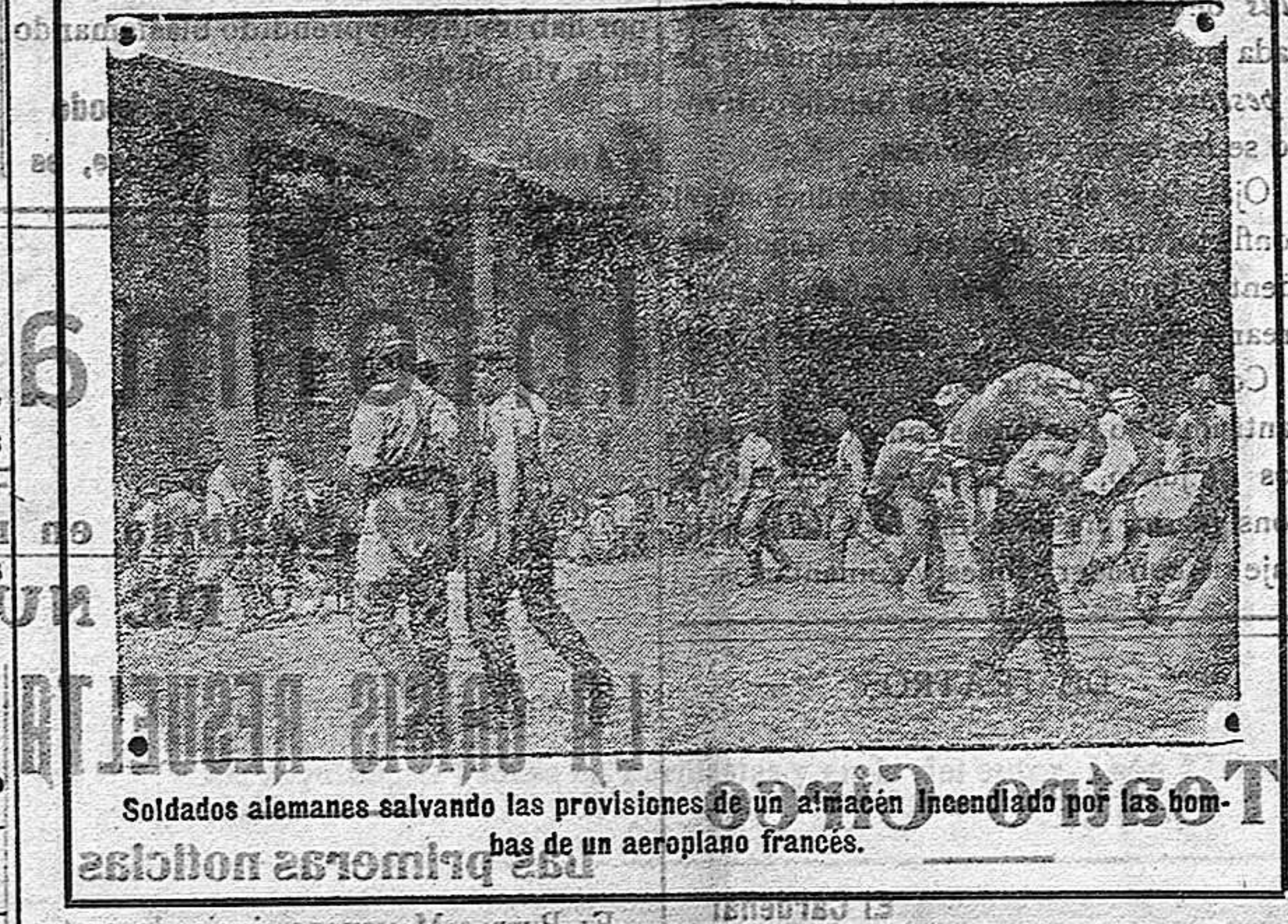
Soldados alemanes salvando las provisiones de un almacén incendiado por las bombas de un aeroplano francés.