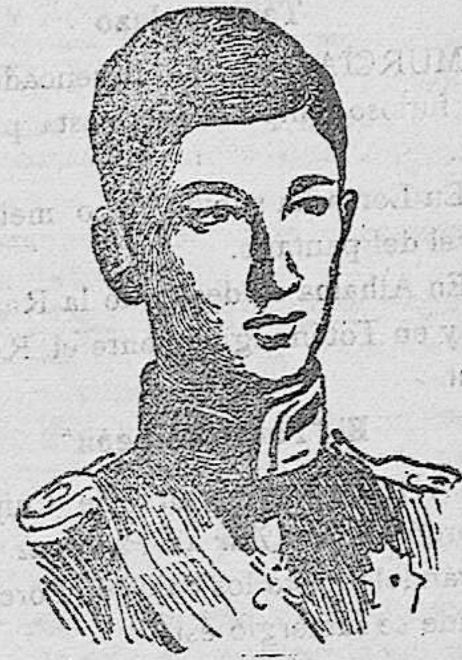
EL PRÍNCIPE BORIS, HEREDERO DEL TRONO DE BULGARIA QUE SE HA PUESTO AL FRENTE DE TRES EJÉRCITOS ENCARGADOS DE CORTAR EL CAMINO ENTRE NICH Y SALÓNICA.

EL PRÍNCIPE BORIS, HEREDERO DEL TRONO DE BULGARIA QUE SE HA PUESTO AL FRENTE DE TRES EJÉRCITOS ENCARGADOS DE CORTAR EL CAMINO ENTRE NICH Y SALÓNICA. SANTA TERESA ROSAS DEL CARMELO