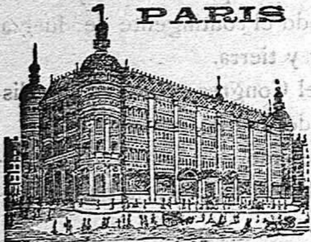
GRANDES ALMACENES DEL

Mantecados a la vainilla a 30 céntimos de pia. uno, de naranja limón y fresa a 25 céntimos de peta uno.