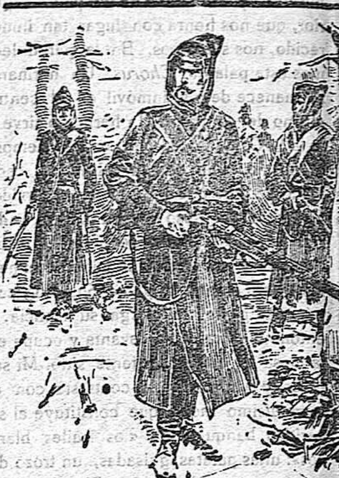
CUADROS DE LA GUERRA

A pesar de las medidas tomadas por las autoridades es dudoso que en el actual estado de guerra se puedan importar viveres. La falta de viveres desmoraliza al pueblo y disminuye el entusiasmo por la guerra.