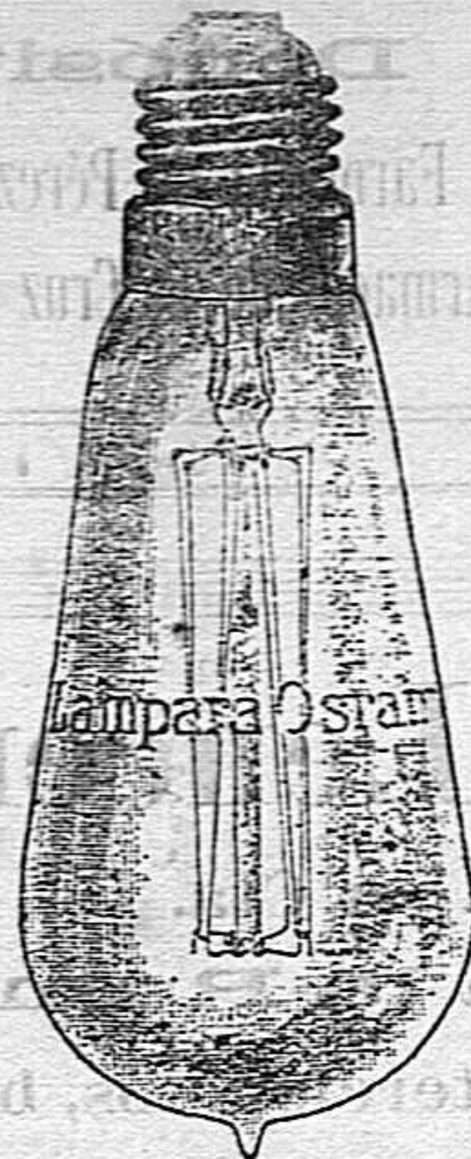
Exijase la marca OSRAM grabada en el cristal