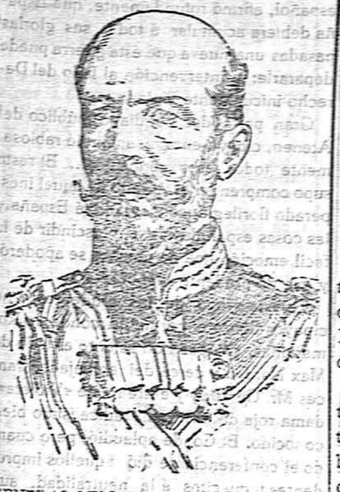
GENERAL MISCHENKO, QUE MANDA EL EJÉRCITO MOSCÓVITA QUE CUBRE LOS SESENTA KILÓMETROS QUE SEPARAN A VARSOVIA DEL RÍO BRUZA, DONDE HOY SE BATEN RUSOS Y ALEMANES.