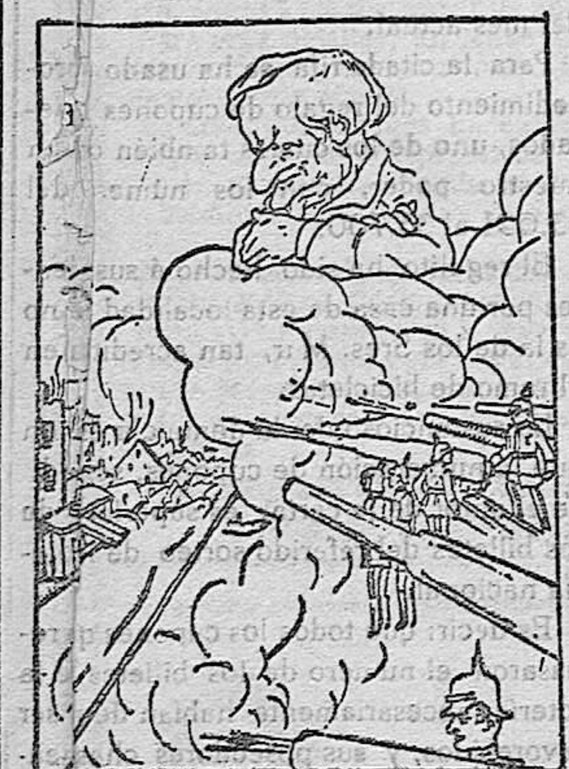
—Por los ecos, bien creí que mis compañeros interpretaban una de mis obras.