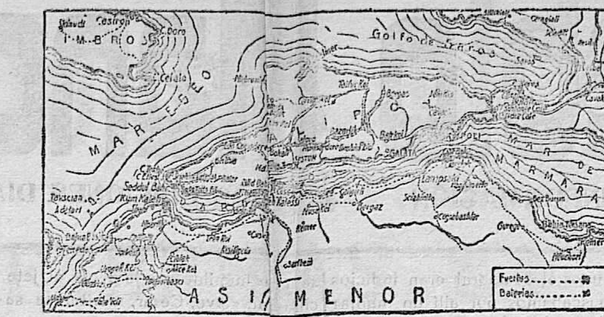
GRÁFICO DEL ESTRECHO DE DARDANELOS Y DE LAS COSTAS OTOMANAS